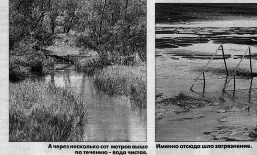
А через несколько сот метров выше по течению - вода чистая. Именно отсюда шло загрязнение.

А это - очень плохо Свежая зелень склонов, густые заросли кустарника заканчиваются вместе с лучезарным настроением: начались золоотвалы ТЭЦ-2. Сразу понимаем: здесь - плохо. На виду - растрескавшаяся зола, небольшое зеркало воды.