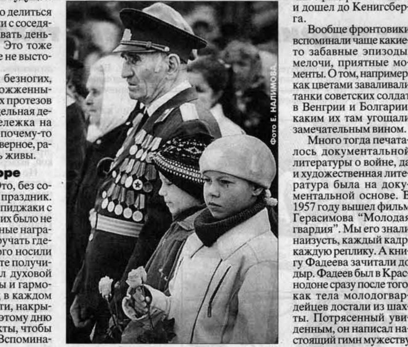
Эта опущенность, что твою жизнь оплачена подвигом наших отцов и дедов, жила в нас, родившихся после войны, очень прочно. Не могу сказать, что это приятное чувство. Оно мучительно, потому что предвещает очень высокий счет к нравственному состоянию личности.

А День Победы... Это, без сомнения, был главный праздник. Фронтовики надевали пиджаки с орденами и медалями - их было не так уж много.