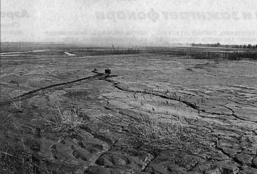
Золоотвал ТЭЦ-2. С подхожей поверхности в воздух поднимаются тончайшие частицы зола-шлаковой смеси.