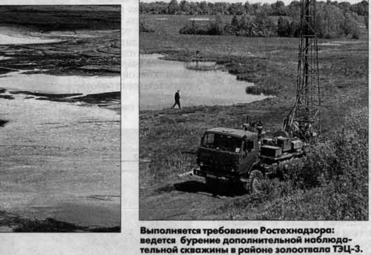
Выполняется требование Ростехнадзора: ведется бурение дополнительной наблюдательной скважины в районе золоотвала ТЭЦ-3.

- Будем разбираться! Бывает загрязнение, но не до такой степени, - говорит эколог. Отправляемся на поиски источника грязевого выброса.