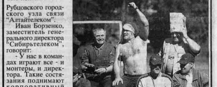
Меч у ворот рубцовской команды. Есть контакт!