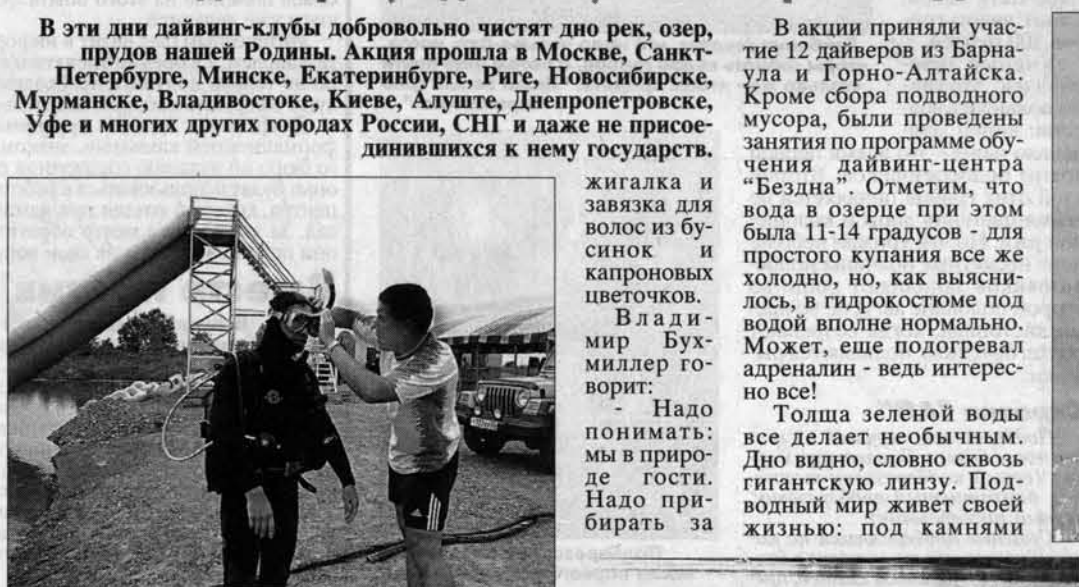
Работа по сути дайвингов, только снаряжение немного сложнее...

В акции приняли участие 12 дайверов из Барнаула и Горно-Алтайска. Кроме сбора подводного мусора, были проведены занятия по программе обучения дайвинг-центра "Бездна". Отметим, что вода в озере при этом была 11-14 градусов - для простого купания все же холодно, но, как выяснилось, в гидрокостюме под водой вполне нормально. Может, еще подогрел адреналин - ведь интересно все! Толща зеленой воды все делает необычным. Дно видно, словно сквозь гигантскую линзу. Подводный мир живет своей жизнью: под камнями