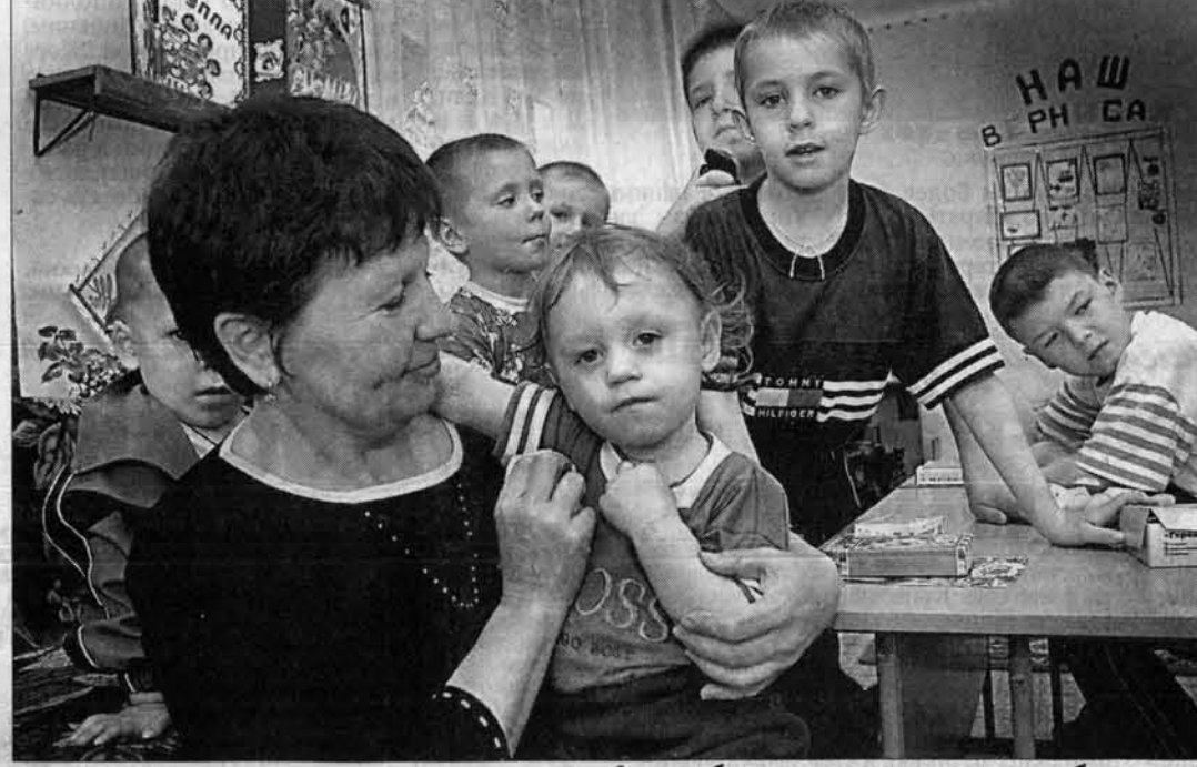
Ах, если бы так же хорошо, как в приюте, было дома!