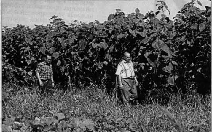
Август-2004: вот так вымалол подсолнечник в рубцовской "Стране Советов".

та занимают нынче около пяти гектаров, поскольку достали лишь мешок семян. Самой востребованной является кукуруза. Из-за малых объемов мешали его с кукурузным. Надо хотя бы гектаров сорок этого подсолнечника, тогда можно выделить. Но пока нет семян. И вторая про-