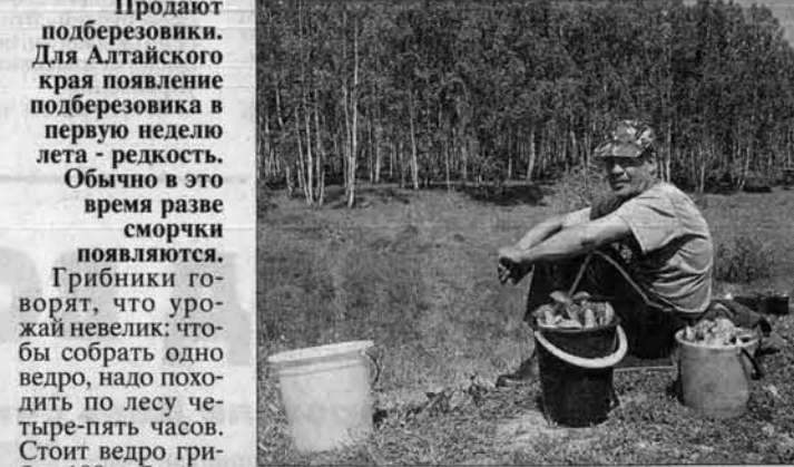
Грибники говорят, что надо четыре-пять часов, чтобы собрать ведро грибов, а потом еще полчаса - чтобы продать. "Люди большой гриб спрашивают..."

С первых летних дней на обочинах дорог появились грибники. Продать подберезовики. Для Алтайского края появление подберезовика в первую неделю лета - редкость. Обычно в это время разведать сморчки появляются. Грибники говорят, что большой гриб собрать одно ведро, надо походить по лесу четыре-пять часов. Стоит ведро грибов 100 рублей. Ученые заверили нас, что грибы появились вовремя: конец мая - начало июня - это время первой волны подберезовиков. Второй слой этих грибов появляется во время цветения липы и колошения ржи. Но эти урожаи небольшие: несметные полчища подберезовиков заполняют роши во второй половине августа, во время листопада, когда созревают орехи, брусника, появляются рыжики. Справка "АП" Подберезовик - лучший из грибов после белого. Бывает трех видов (серый подберезовик-тонок, бархатистый подберезовик, черный подберезовик). Сухие подберезовики по калорийности стоят наравне с баклажанами и ржаным хлебом, превосходят по полезности капусту, огурцы и лук. Молодые подберезовики везде хороши: в супе, в жареном виде, в кулебяках, пирогах, соусе, соляных, маринаде и в сушеном виде.