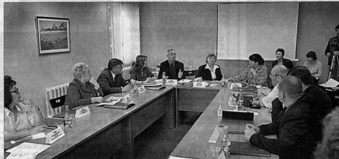
На такие рабочие совещания представители Ассоциации КОРСИ собираются два раза в год.