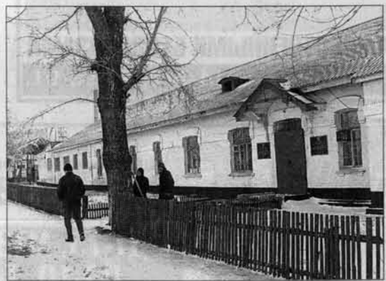
Здание Алтайской транспортной милиции было построено в начале прошлого века. Раньше в нем находилось железнодорожное депо.