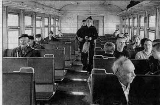
За 4 месяца этого года сотрудники АЛУВД сопроводили около полутора тысяч электричек и более 500 поездов.

- Насчет возможности терактов вас инструктировали, как это делается сейчас? - Чтобы мы изымали бомбы или даже гранаты - у нас Бог. В лучшем случае находили большой патрон, набитый взрывчаткой. А в остальном