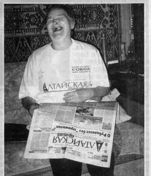
Прогноз погоды - обхохочешься!