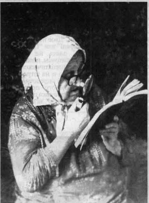
А в молодости буквы были крупнее...