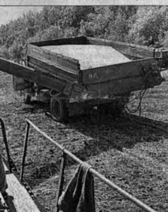
Семена - основа будущего урожая.

Вместе с тем за последнее пятилетие удалось существенно обновить комбайновый и тракторный парк. Теперь дело за кормозаготовительной техникой.