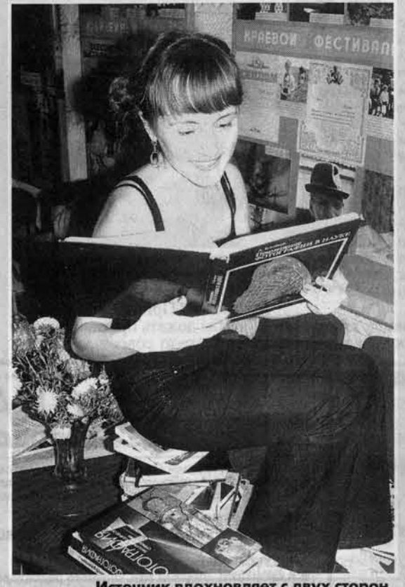
Источник вдохновляет с двух сторон.

Но редакция решила расширить рамки и дополнила конкурс номинацией "Человек с газетой". В итоге получилось "Человек читающий". 1 мая прием работ на конкурс завершился. Сегодня мы публикуем еще несколько фотографий, присланных в редакцию. А в конце мая в краевой библиотеке будет оформлена выставка работ наших читателей, которые дружат с книгой, газетой и фотоаппаратом. Награждение победителей конкурса состоится 27 мая, когда в России будет отмечаться День библиотек. Возможен, среди победителей, кто-то из краевой библиотеки имени Шишкова подарит хорошие книги, окажется и кто-то из авторов этих снимков.