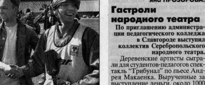
"КОРД" - управа на "Штрафбата".

По приглашению администрации педагогического колледжа в Славгороде выступил коллектив Сербского народного театра. Деревенские артисты сыграли для студентов педагогов спектакль "Трибунал" по пьесе Андрея Мамлетова. Вырученные за выступление деньги, около 1000 рублей, самостоятельно артисты планируют израсходовать на декорации и костюмы к новому спектаклю по пьесе Григория Горина "Забить Герострата". Елена КОКОЧКО.