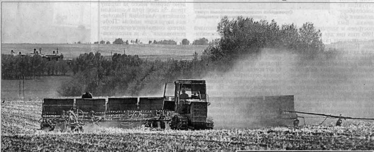
Работа кипит: день год кормит.

в "Горьковском" не видят перспектив развития. Повышение культуры земледелия и работы в животноводстве позволило бы получать более весомые прибыли. Ежегодный надой на корову здесь сегодня составляет восемь литров молока.