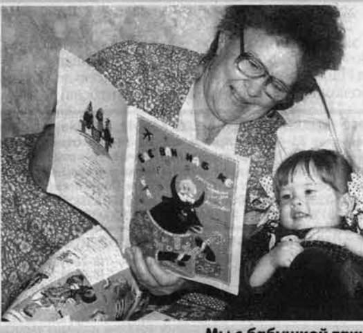
Мы с бабушкой такие книголюбы!

В конце прошлого года ("АП" N 330-331) газета объявила о своей поддержке фотоконкурса "Человек с книгой", который инициировала краевая библиотека имени Шишкова