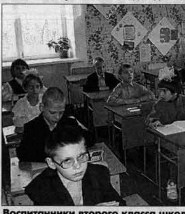
Воспитанники второго класса школы на учебных занятиях.