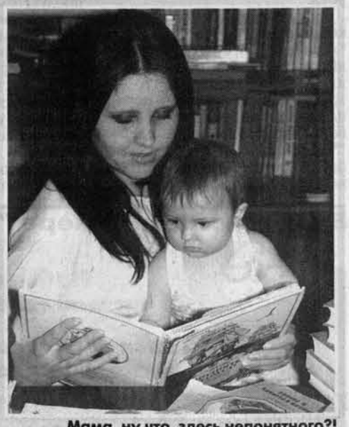
Мама, ну что здесь непонятного?!