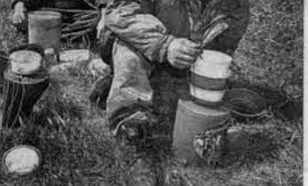
Полеводческая бригада на обеде.

К неурожайю готовься, а хлебушек сей, - слышу в ответ. - Все равно когда-то правительству повернется к крестьянину лицом. Да и дождь в первой половине июня просто обязан быть. А будет дождь - и урожай будет.