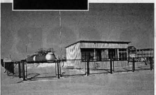
Строющийся газонаполнительный пункт с автозаправочной станцией.