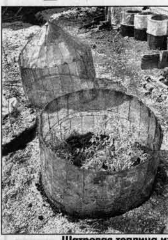
Шатровая теплица из пластиковых бутылок: нижняя и верхняя части.