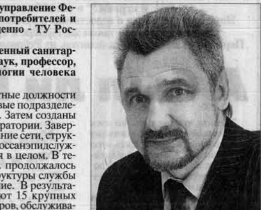
Новая служба - территориальное управление Роспотребнадзора - проводит проверки не только в порядке надзора, но и по письменным заявкам или жалобам населения и предприятий.

Реформирование произошло не вдруг. Преобразования начались еще в 1997 году с разработки и реализации краевой целевой программы "Развитие государственной санитарно-эпидемиологической службы в Алтайском крае". На первом этапе были пере-