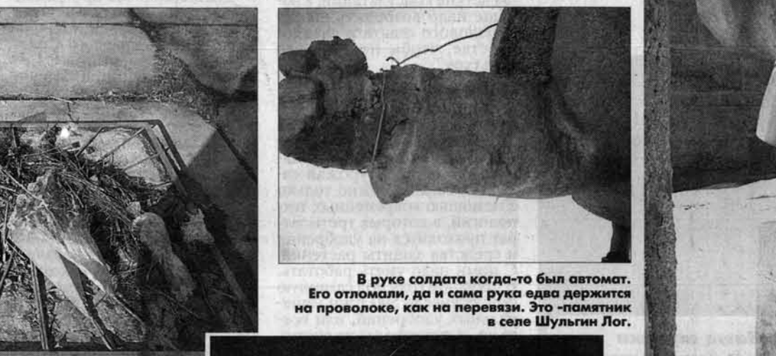
В руке солдата когда-то был автомат. Его отомали, да и сама рука едва держится на проволоке, как на перемычке. Это - памятник в селе Шульгин Лог.

Из десяти увиденных корреспондентом "АП" памятников в Советском районе ни один не был в безупречном состоянии