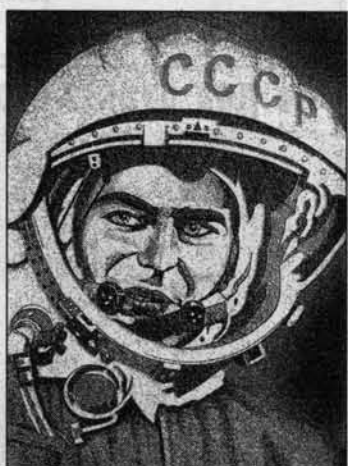
Портрет Германа Титова работы художника Василия Степаненко.

фонный звонок из Москвы. Звонил Герман. Спрашивал, что нужно для встречи, сказал, что готовит сувениры для всех. Встречу запланировали в ресторане "Барнаул". Я поехала заранее, чтобы встретить гостей. Но что я вижу! На крыльце ресторана стоит Герман в темно-голубом костюме, светло-голубой рубашке - встречает гостей. А позже, когда ему предоставили слово на банкете, он каждому из нас преподнес свою книгу "Голубая моя планета". Одежды в темно-голубой костюме - дарил голубую планету. Это было что-то!