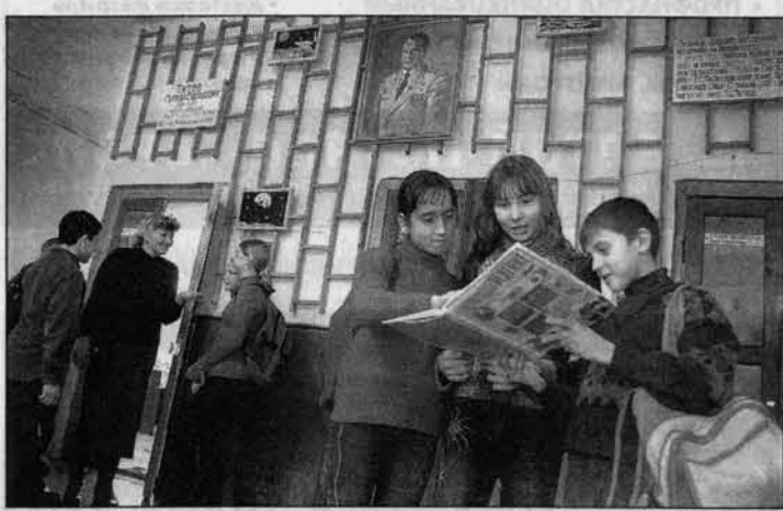
В Налообихинской школе, которую оканчивал будущий космонавт.

фонный звонок из Москвы. Звонил Герман. Спрашивал, что нужно для встречи, сказал, что готовит сувениры для всех. Встречу запланировали в ресторане "Барнаул". Я поехала заранее, чтобы встретить гостей. Но что я вижу! На крыльце ресторана стоит Герман в темно-голубом костюме, светло-голубой рубашке - встречает гостей. А позже, когда ему предоставили слово на банкете, он каждому из нас преподнес свою книгу "Голубая моя планета". Одежды в темно-голубой костюме - дарил голубую планету. Это было что-то!