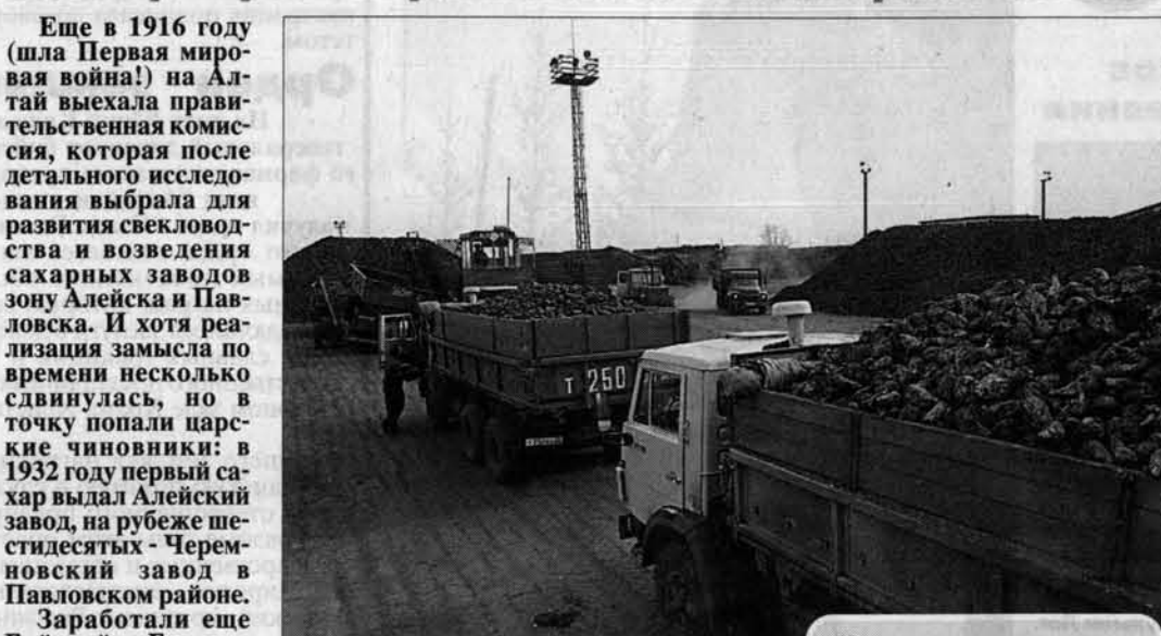
Осенью на Черемновский сахарный завод потоком поступает свекла из хозяйств.

Еще в 1916 году (шла Первая мировая война!) на Алтай выехала правительственная комиссия, которая после детального исследования выбрала для развития свекловодства и возведения сахарных заводов зону Алейска и Павловска. И хотя реализация замысла по времени несколько сдвинулась, но в точку попали царские чиновники: в 1932 году первый сахар выдал Алейский завод, на рубеже шестидесятых - Черемновский завод в Павловском районе.