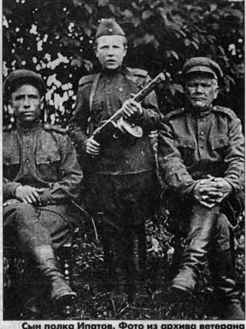
Сын полка Ипатов. Фото из архива ветерана тоже успели спасти от огня.