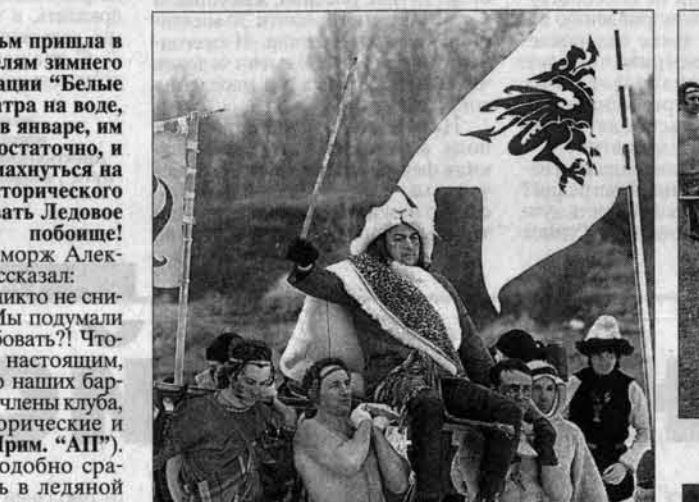
Долгожданная батальная сцена. Дрались актеры правдоподобно.

Сюжет фильма несложный: сначала варвары нападали на рыцарей, потом - батальная сцена, а потом - все в проруби! Мерзнувшие зрители просили снимать без проруби, были просто счастливы! Ну, не завоевали ничего, так хоть искупались... Фильм будет смонтирован в ближайшие дни. Надеюсь, корреспонденты "АП" будут в числе первых (и не последних) его зрители. Удается ли нашему кино пережить "Ночной дозор" и прочие "турецкие гамбиты", мы вам обязательно сообщим.