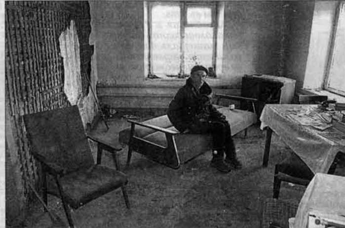
Ветеран приходит в свой погорелый дом каждый день.