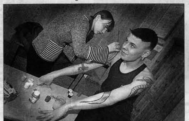
Работает стилист из кружка "Фантазия" школы № 7.