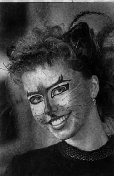
"Девушка-кошка", ЦДТ № 2.