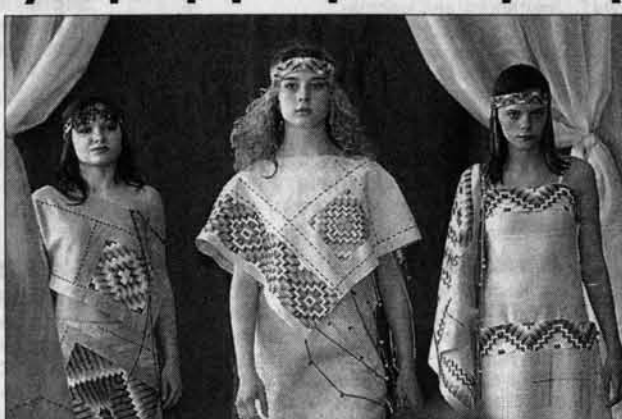
Узоры старины далекой...