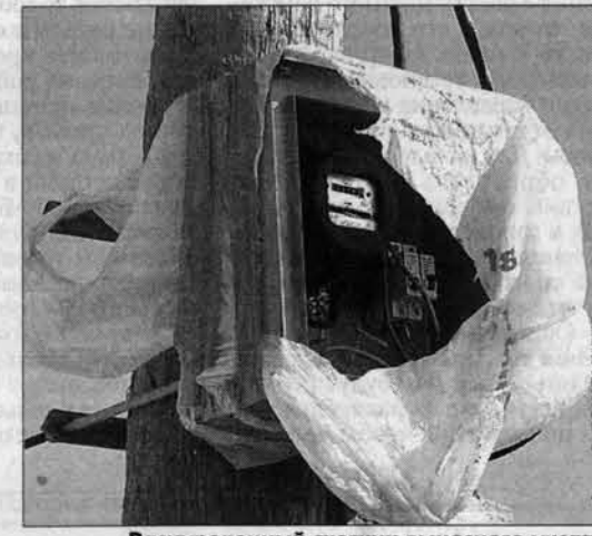
Раскрученный счетчик выносного учета на Карьерной.

Корреспонденты "АП" участвовали в рейде "Алтайэнерго" по выявлению энергворов Самые добросовестные абоненты энергокомпаний - люди небогатые. Еле сводят концы с концами, они все равно платят за электричество. Больше всего проблем с тем, у кого, по меркам большинства, проблема нет. Они не только могут позволить себе баснословные долги за электричество по 30-50 тысяч рублей. Они хорошо знакомы с различными способами обмана: чтобы отапливать свои сауны и бассейны, в коттеджах откручивают назад счетчики, делают скрытую электропроводку... По данным "Алтайэнерго", самые vorоватые места сейчас как раз там, где идет массовая коттеджная застройка: в пригородах Барнаула, Новоалтайска, Павловске. Едем в Пригородный - район электрических сетей - это село Власиха и коттеджный поселок Лесная поляна.