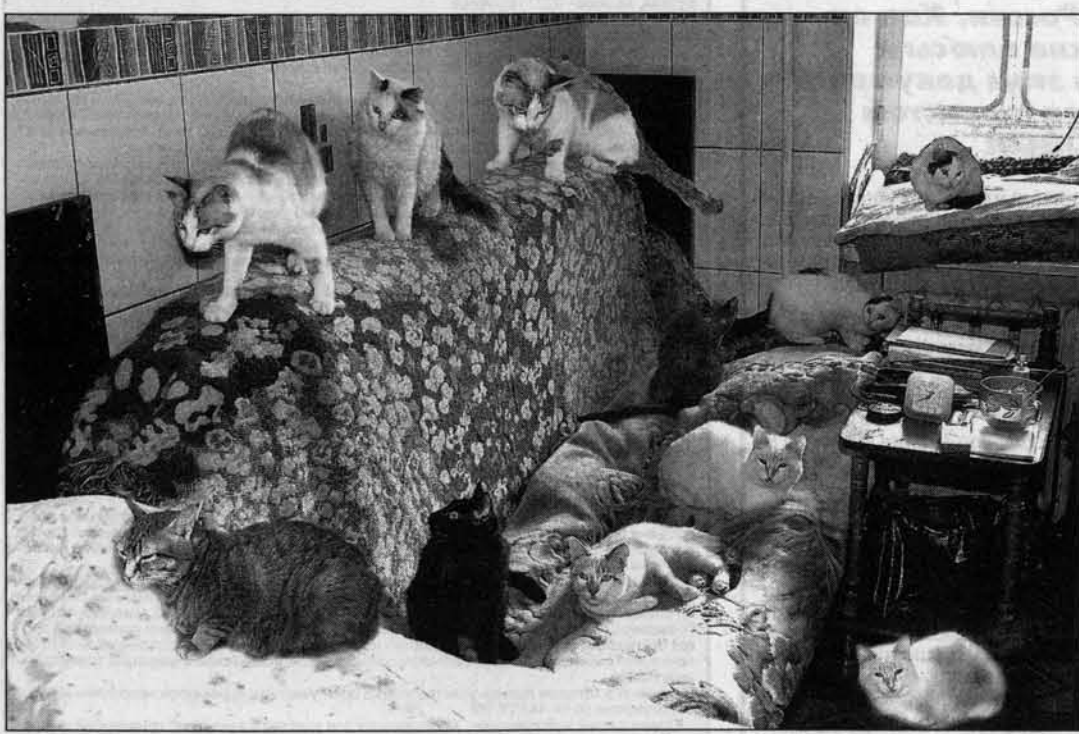
Муська, Мурка, Васька... и т.д., и т.п.