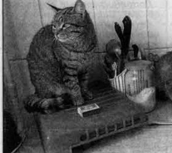
Ждут обеда на обеденном столе.