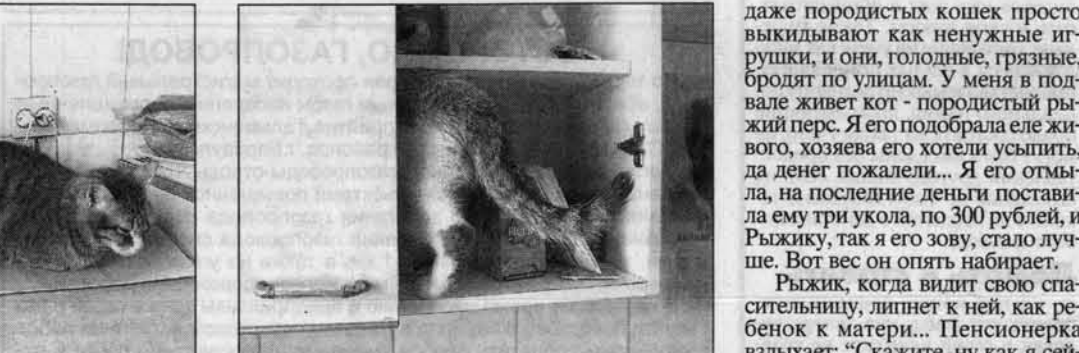
Опять в шкафу "мышь повесилась".