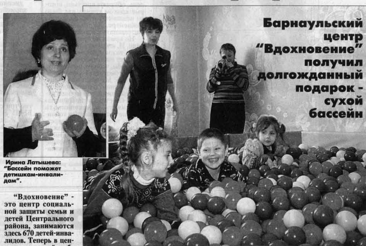
Сухой бассейн - это шесть тысяч цветных шариков, детям он очень нравится.