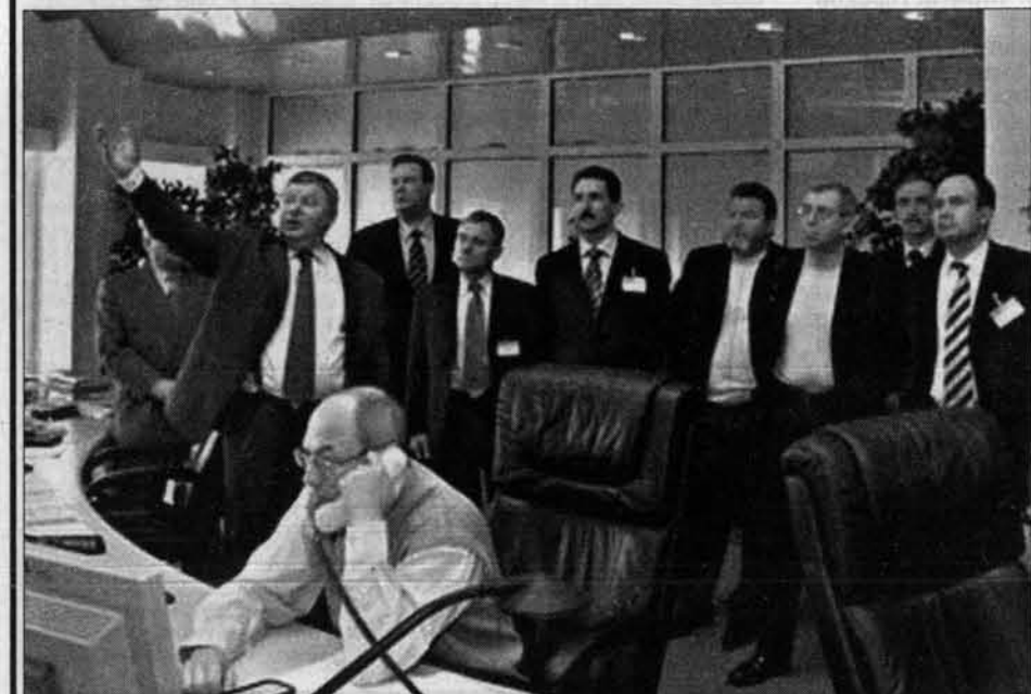
Главы регионов в диспетчерской ОАО "Газпром".