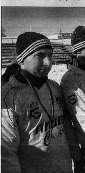
Приз от фирмы "Алтайгротех" чемпионом сельской олимпиады - футболистам Ключевского района.