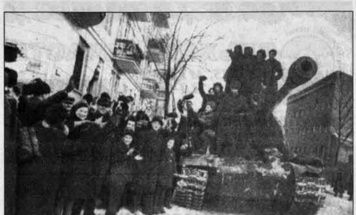
Встреча советских войск жителями г.Познань, 1945 г.