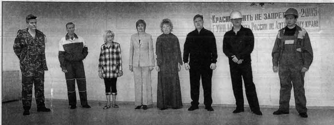
Модели, представленные на суд жюри.

Второй этап Всероссийского конкурса "Красиво шить не запрещать" прошел в ГУИН 26 января. Жюри отобрало лучшие модели одежды, изготовленные заключенными, для отправки в Москву на третий этап конкурса.