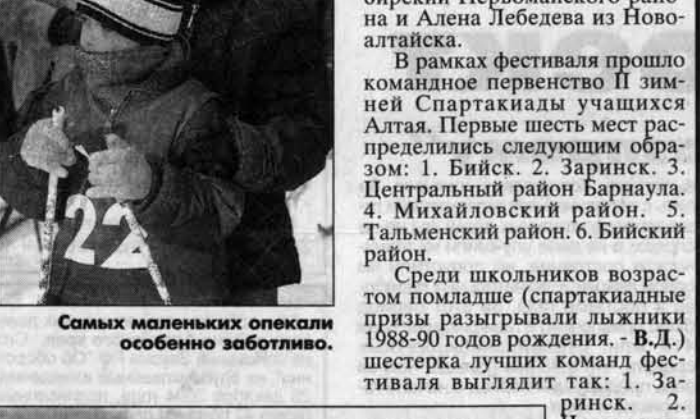
Самых маленьких опекали особенно заботливо.