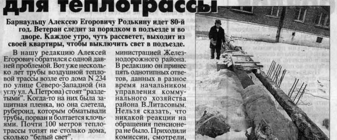
Одним матрасом не закроешь 100 метров теплотрассы.