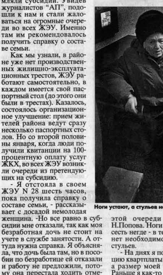
Вот так очереди...