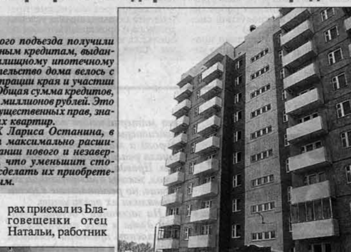
Так получилось, что первый подъезд дома по ул. Чеглецова, 54 сдали последним, как раз под Новый год.