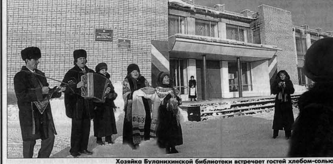
Хозяйка Буланихинской библиотеки встречает гостей хлебом-солью.