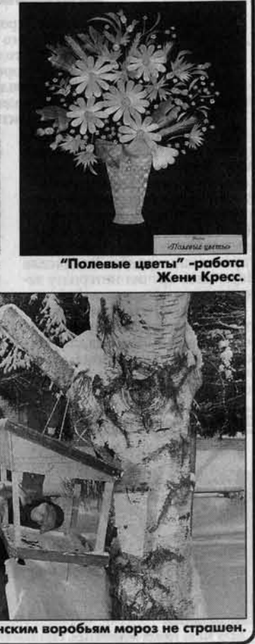
Буланихинским воробьям мороз не страшен.