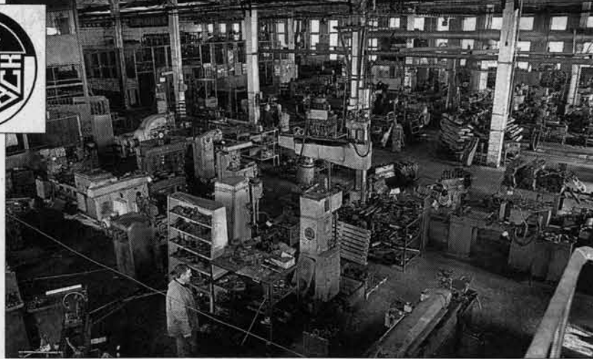
Сборочный цех двигателей.