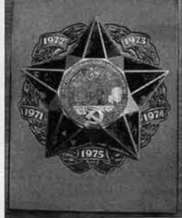
Та самая "Звезда".