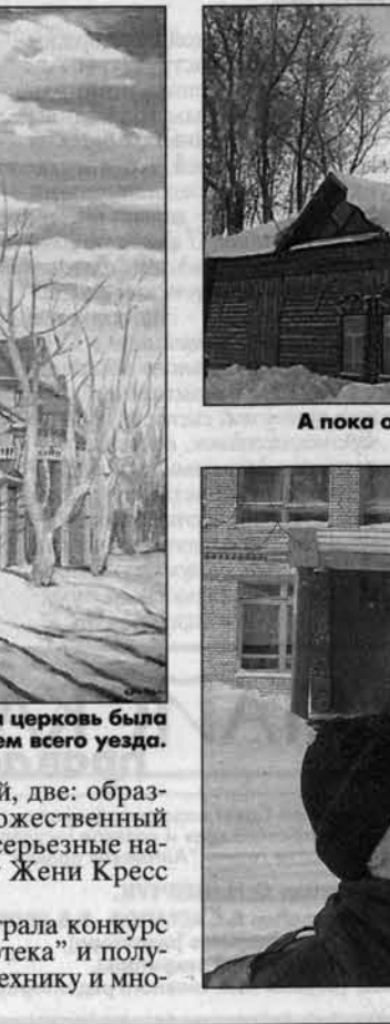
А пока она разместились в этом старом доме.