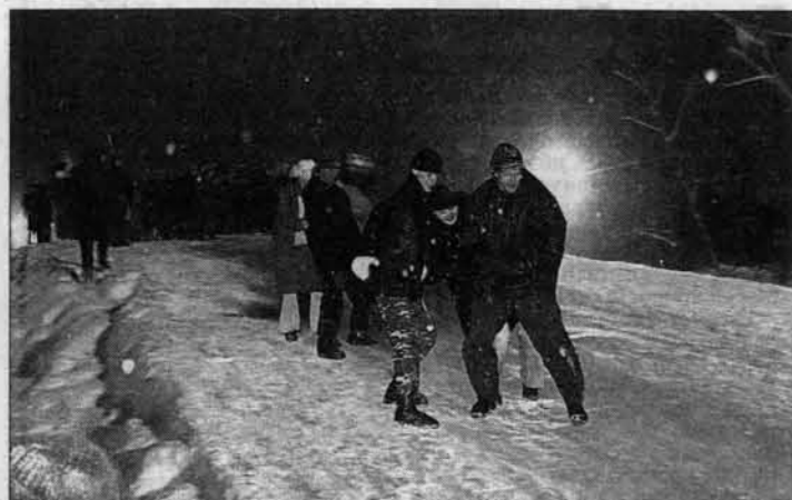
На Народной площади: эх, прокатулы

Новогодне-рождественские "каникулы" растянулись нынче на десять дней