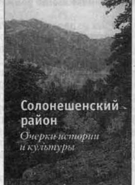
Солонешенский район. Очерки истории и культуры.