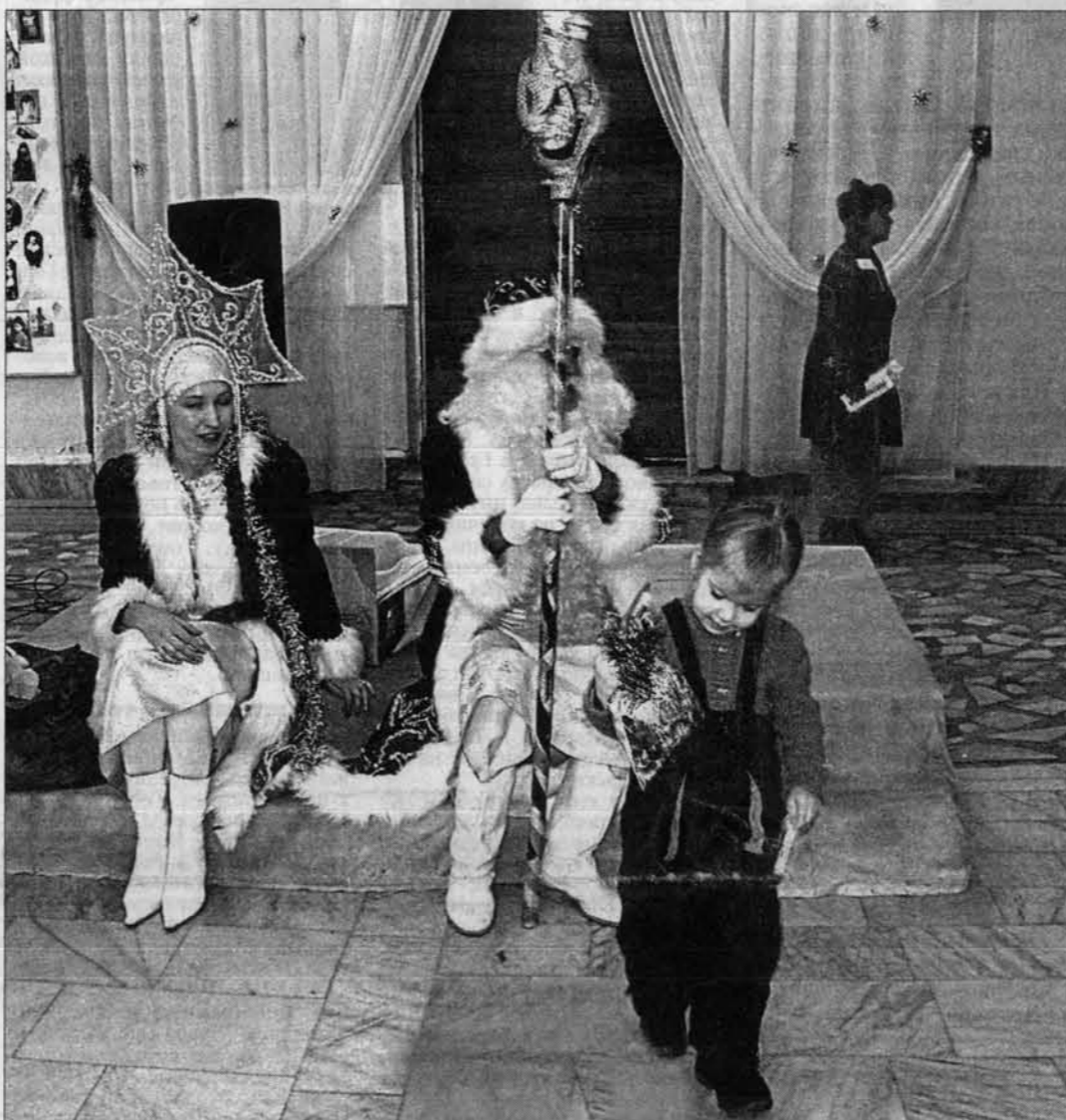
Ну наконец-то праздник кончился