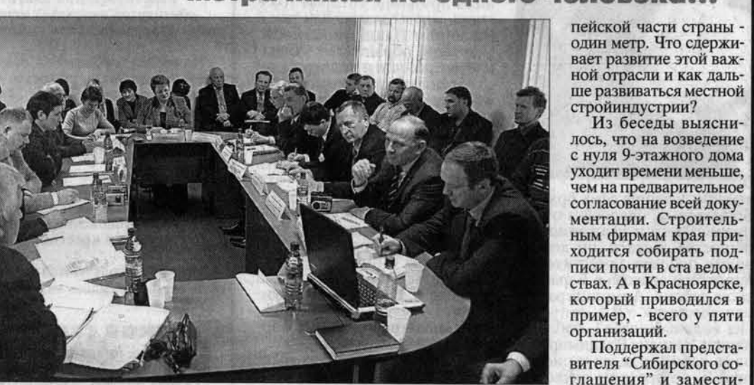
"Строить надо социальное жилье" - в этом мнении участники "круглого стола" были едины.

О том, как переломить эту ситуацию, шла речь во вторник, 23 ноября, в конференц-зале Алтайской ТПП. Здесь был "круглый стол" на тему: проблемы строительного комплекса и возможные пути их решения.