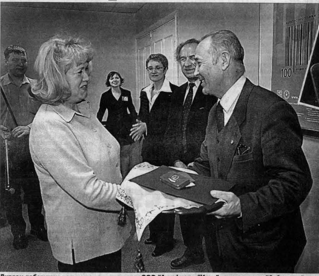
Диплом победителя вручается представителю ООО "Агрофирма "Иван" - их польмены "Сибирские" тоже вошли в число лучших товаров страны.

Вчера в Барнауле состоялось награждение алтайских лауреатов и победителей конкурса "100 лучших товаров России"