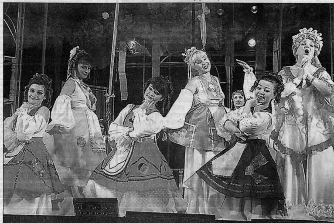
Поющий и танцующий хор - украшение спектакля.