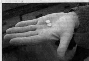
На этом приборе сделана первая серебряная таблетка.