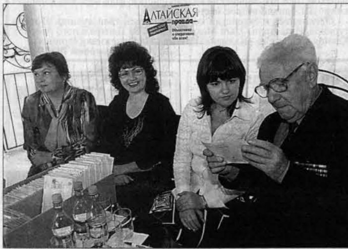
Комиссия за работой.

Не возбранялось присутствовать на розыгрыше всем желающим. Поэтому за процессом наблюдали и журналисты газеты, и заглянувшие в редакцию рекламодатели, и особо недоверчивые подписчики, которые своими глазами хотели убедиться, что все по-честному.