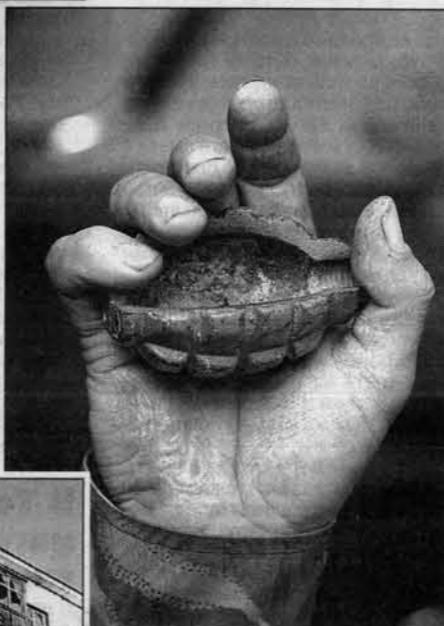
Сувениры у Оськина соответствующие - вот это, например, пепельница, выпиленная из гранаты Ф-1.

принимал на МВД, а другому ведомству, и потом мне его уже не давали, работал в лучшем случае в бронжилете. Смотрю - и правда лежит. Про-