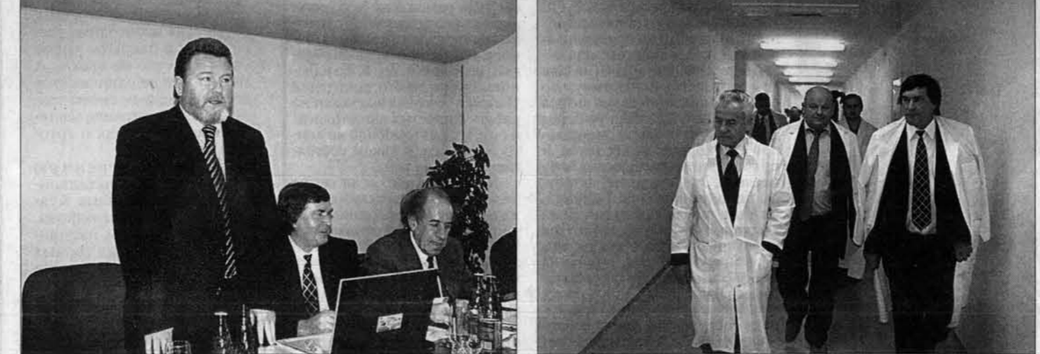
Губернатор выступил перед промышленниками.

Поддерживать надо тех, кто наращивает производство