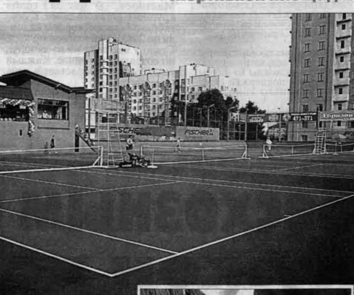
Новый теннисный court в Барнауле.

В Барнауле завершено строительство теннисного центра имени В.Д. Головина. 10 сентября состоялось открытие новой спортивной площадки.