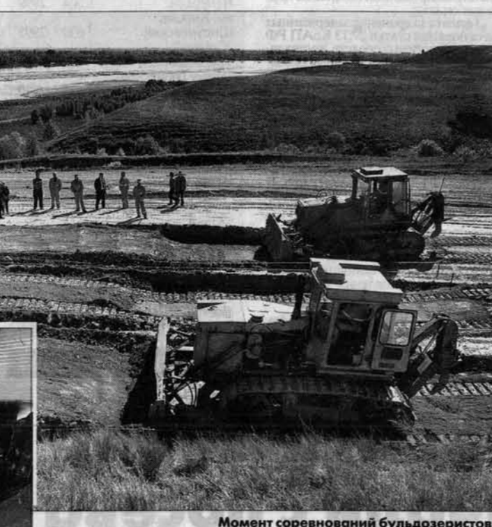
Момент соревнований бульдозеристов.

Состоялись соревнования водителей дорожной техники и открытие школы "Лучший по профессии"