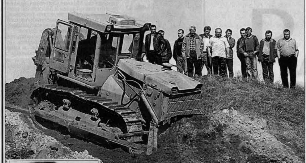
Работы - не разгести...

Состоялись соревнования водителей дорожной техники и открытые школы "Лучший по профессии"