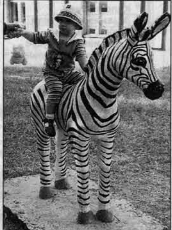
На углу пр. Социалистического и ул. Чкалова.