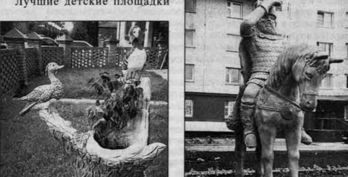
Павловский тракт, 111.