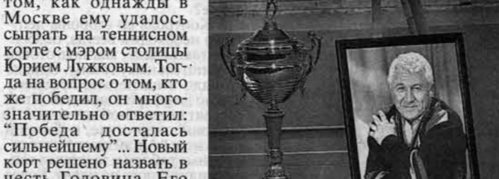
Кубок имени В. Головина.