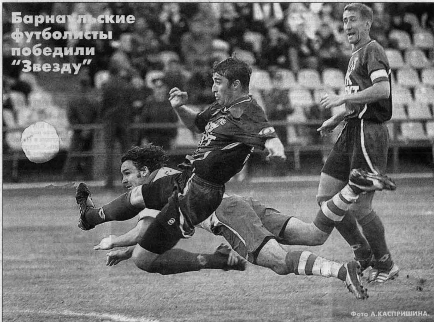
Барнаулские футболисты победили "Звезду"