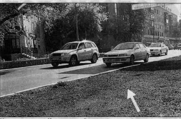
Мину нашли на Красноармейском проспекте, почти напротив магазина мобильных телефонов. Мина была без взрывателя. А вообще радиус поражения у нее - 100 метров.

9 сентября около трех часов дня в Барнауле в самом центре города, на проспекте Красноармейском, обнаружили 82-миллиметровую мину