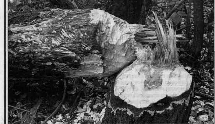
Вот так "работают" бобры.

Они подгрызли несколько тополиных стволов, один из ко-