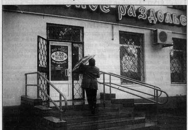
Своя торговая сеть в Рубцовске, в планах - Барнаул.

В связи с перекладкой теплотрассы через ул. Малахова закрывается движение всех видов транспорта: с 20.00 часов 10.09. до 06.00 часов 13.09. по ул. Малахова (нечетная сторона) от ул. Юрина до ул. Чудненко. с 20.00 часов 17.09. до 06.00 часов 20.09. закрывается движение по ул. Малахова (четная сторона) от ул. П. Сухова до ул. Юрина.