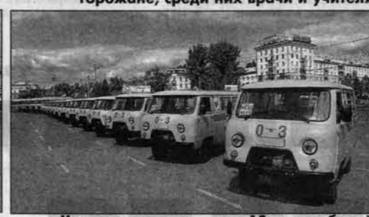
Через несколько минут 15 автомобилей "скорая помощь" отправится к месту назначения.

та" до ноября этого года в край поступит 188 автомобилей "скорой помощи" - для всех районов и большинства городов, для 24 краевых лечебных учреждений. Кроме того,