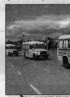
Эти школьные автобусы прибудут в пять районов и в краевую школу для слабослышащих детей.