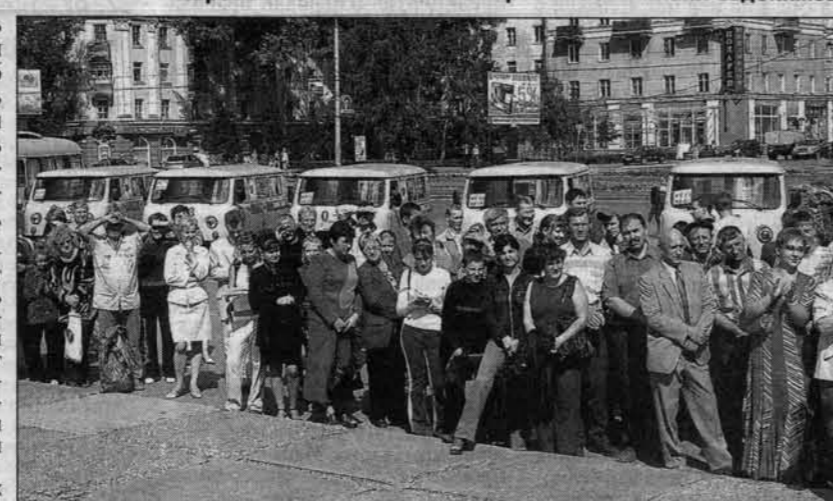
К моменту вручения транспорта на площади Советов собрались горожане, среди них врачи и учителя.

Всего же в рамках губернаторской программы "Здоровье Ал-