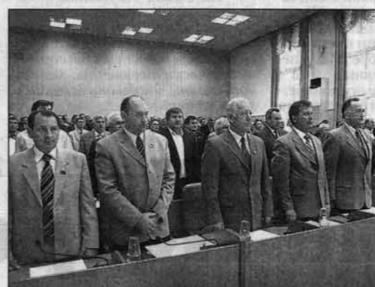
Депутаты почтили память погибших накануне в авиакатастрофах россиян.

26 августа состоялась четвертая сессия крайсовета