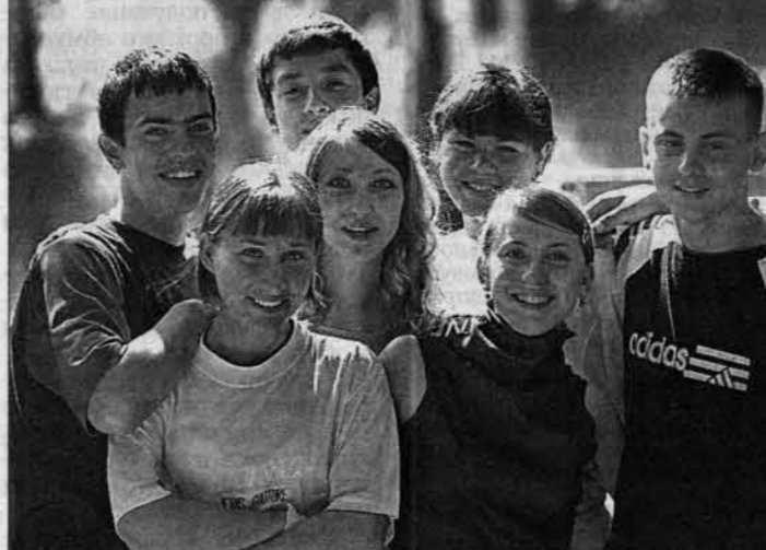
Почти вся команда стройотряда.

- Мы линолеум в спальни укладываем, и они забавно. Радостные такие, начали с нами знакомиться, расспрашивать, как и что делаем. А еще поблагодарили, что мы помогли им дому.