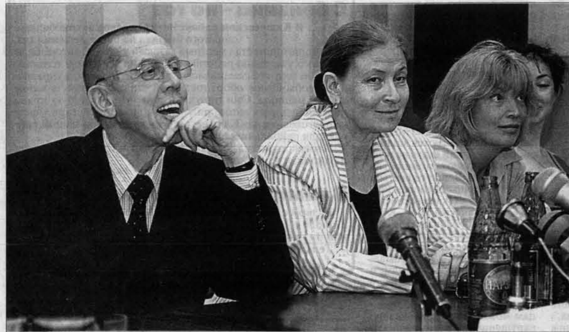
Почетные гости VI зрительского кинофестиваля: Валерий Золотухин, Людмила Зайцева, Ольга Остроумова на пресс-конференции.

Главное культурное событие алтайского лета получило статус всероссийской акции Пресс-конференция