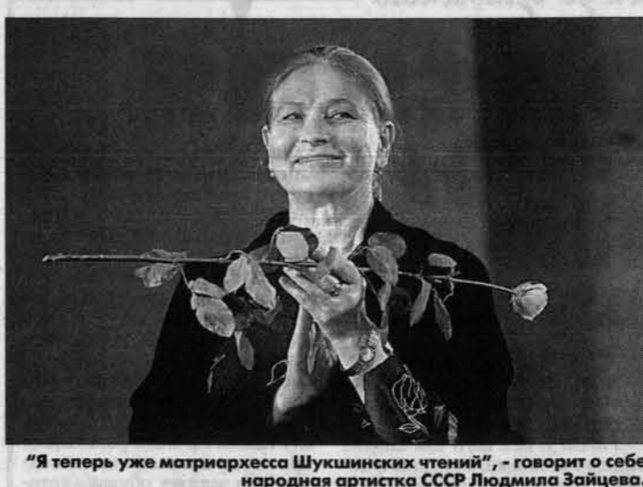
"Я теперь уже матриархесса Шукшинских чтений", - говорит о себе народная артистка СССР Людмила Зайцева.

Много лет приезжает на праздник в Сростки актриса Людмила Зайцева. Она даже в шутку себя назвала патриархом, впрочем, тут же переступив этот титул Валерию Золотухину, а сама согласилась быть матриархской. И призналась, что каждый год волнуется: позвонит ли по телефону на Алтай. И каждый раз заново счастлива, когда приезжает на родину Шукшина. Радая, что "шукшинская обойма" пополняется молодыми. Если верна примета, которая уже сложилась за время жизни Шукшинского кинофестиваля, что те, кто побывает здесь, потом быстро идут "в рост", то и нынешних дебютантов нашего кинофорума ожидает прекрасное творческое будущее.