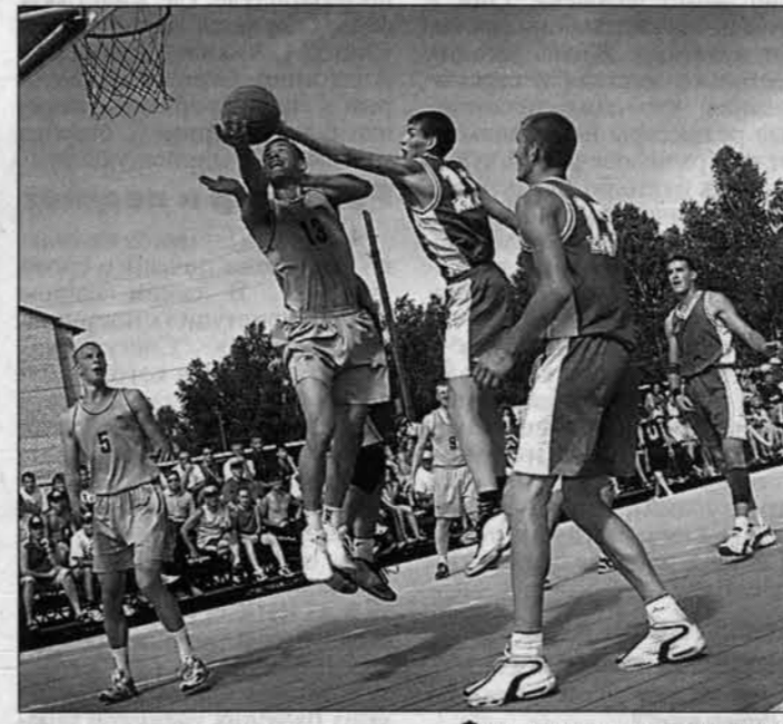
Финальное противостояние: Бийский район - Павловский район.