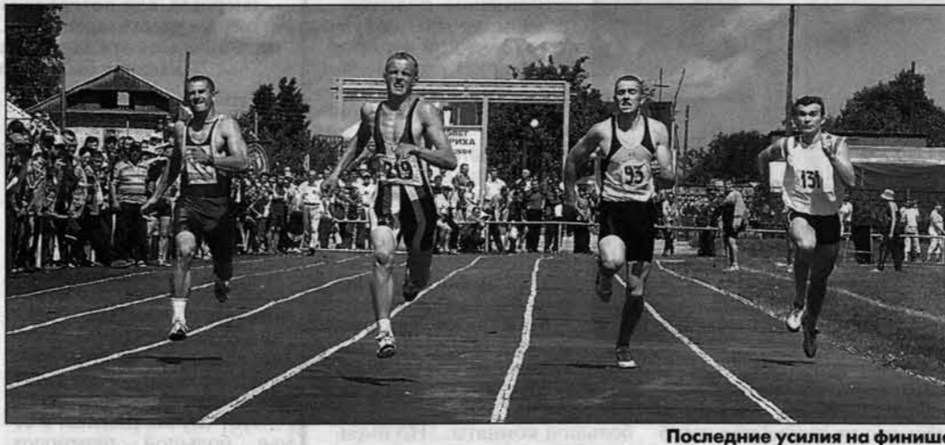
Последние усилия на финише.

В этом году спонсоров у олимпиады оказалось гораздо больше, чем было ранее. Один из них агропромышленная компания "Хлеб Алтай" - крупнейший переработчик зерна за Уралом. Ее мука высшего сорта стала "Лучшим алтайским товаром-2001" и вошла в "100 лучших товаров России-2002". Сегодня продукция АПК "Хлеб Алтай" покупат-