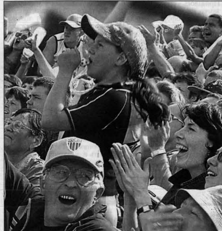
Так ребрихинские болельщики болели за своих.