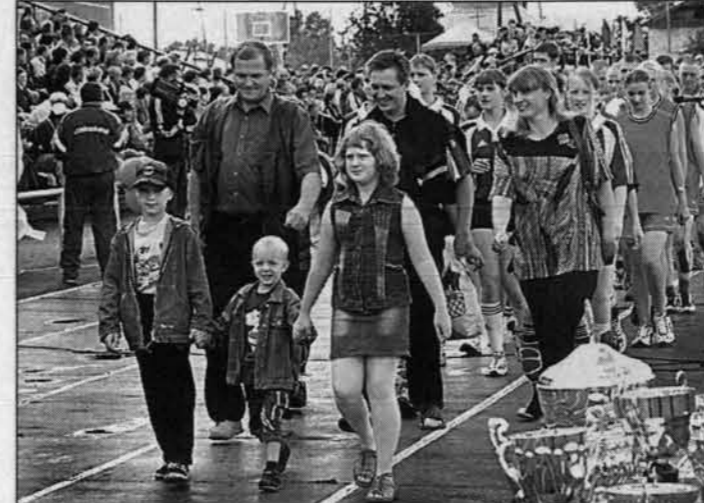
На соревнованиях приезжали семьями.

оне смели за 15 минут. Возможно, продукцию "РИКИ" просто раскупили - она была в рационе питания спортсменов с самого начала олимпиады.