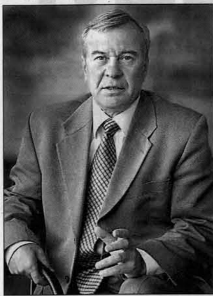
режиссером, их технической оснащенности. Но при этом я вижу, что их творчество часто идет мимо человека. Они в этом не виноваты - они так видят этот мир. Жизнь сегодня настолько жесткая и стремительная, что даже талантливые режиссеры не заглядывают внутрь человеческой души. Они как будто боятся, что это может причинить им боль.