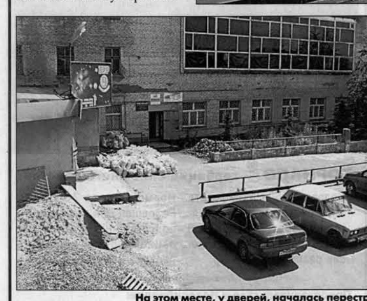
На этом месте, у дверей, началась перестрелка.

В этом деле осталось много неизвестностей. В пресс-службе краевого УВД заявили: "Мы не комментируем это событие". В частных беседах сотрудники милиции говорили, что на место перестрелки довольно быстро приехал СОБР и якобы ирешетил мафиозные машины. Однако местные жители рассказывали, что милиция приехала уже после того, как жулики, постреляв, уехали сами.