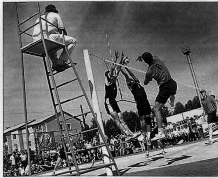
Мамонтовских голыми руками не возьмешь.