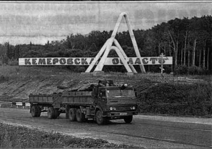
На Алтай идет кузбасский уголь.