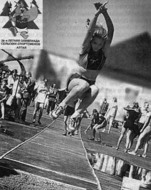
Прыжок за медалью.