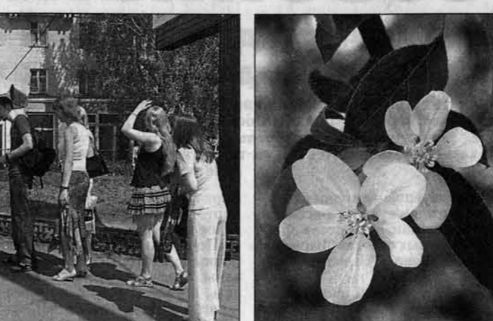
А зато... В жару быстро сохнет белье. Меньше хочется есть.