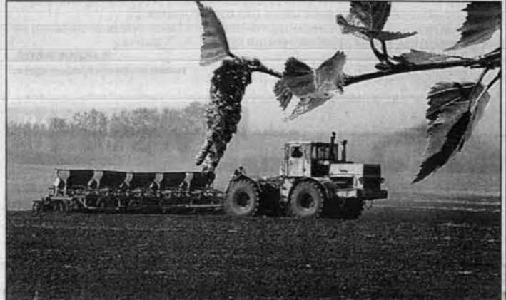
Сева в разгаре.

то в аренду акционерным обществом "Мельник". Хозяйство не смогло в одиночку справиться с целым ворохом экономических неурядиц, и мощное плечо одного из крупнейших в крае зернопереработчиков пришлось здесь как нельзя кстати. - В "Котляровке" 5300 гектаров пашни, - рассказывает генеральный директор ОАО "Мель-