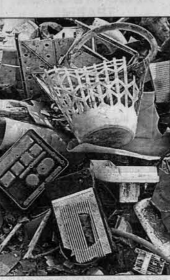
Свалки - типичная картина в лесу, на берегу, у порога...

На днях поинтересовался, кому нужно было выжигать конкретную степную делянку, зачем циркали спичкой? Сказали, мол, пастухи в целях безопасности выжигали траву, чтобы уничтожить клею, а то много укушенных коров. Хотели как лучше? Кстати, настоящие клею (и об этом спорят ученые) - природный фактор (такой же, как потепление) или техногенный? Однозначного вывода нет, а причина та же: отношение человека к среде обитания. Своими руками создаем проблемы, рубим сук, на котором сидим.