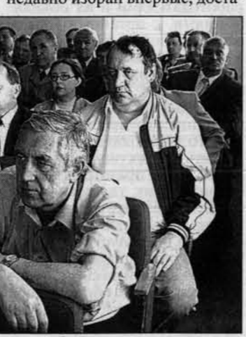
Главам районов было над чем задуматься.