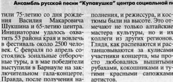
Ансамбль русской песни "Купавушка" центра социальной помощи "Вдохновение", Барнаул.