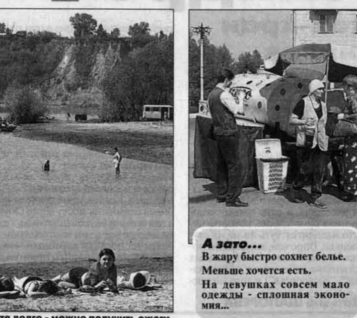
Не загорайте долго - можно получить ожоги.

Сводка о ходе ярового сева на 17 мая (по данным крайсельхозуправления - без учета фермерских хозяйств). Первая колонка цифр - посевы зерновых культур, вторая - кормовых (все - в процентах к намеченным объемам). Петропавловский 74 39 Смоленский 67 38 Алтайский 61 38 Бийский 58 30 Быстринский 57 83 Третьяковский 57 20 Тогуский 56 43 Косихинский 52 0 Троицкий 48 13 Советский 47 48 Ключевский 46 53 Локтевский 46 23 Родинский 45 78 Заринский 44 23 Целинный 42 59 Топчихинский 40 49 Усть-Калманский 40 33 Павловский 40 33 Шелаболихинский 39 72 Благовещенский 38 64 Романовский 38 29 Томовский 37 60 Шпунтовский 37 34 Красногорский 37 23 Табунский 36 48 Кулундинский 35 38 Усть-Пристанский 35 33 Рубцовский 34 37 Кытмановский 34 24 Краснощековский 33 44 Егорьевский 32 47 Алейский 32 37 Тальменский 32 33 Михайловский 32 31 Зональный 31 39 Первомайский 31 37 Чарынский 31 30 Ельцовский 30 14 Земногорский 29 26 Суетский 28 52 Хабарский 28 43 Калманский 28 25 Бурлинский 28 19 Курьинский 28 14 Славгородский 27 36 Зеленовский 26 30 Крупнинский 26 22 Волчихинский 25 59 Бавский 25 30 Панкрушихинский 24 79 Завьяловский 24 43 Новичихинский 24 35 Солтонский 24 18 Мамонтовский 23 36 Ремизинский 22 20 Каменский 22 31 Угловский 22 7 Поспелихинский 20 45 Солонешенский 19 3 По краю 36 47 Зерновыми засеяно 940 тыс. га. Было в 2003 г. 672,9 тыс. га.