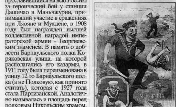
Плакат времен русско-японской войны.