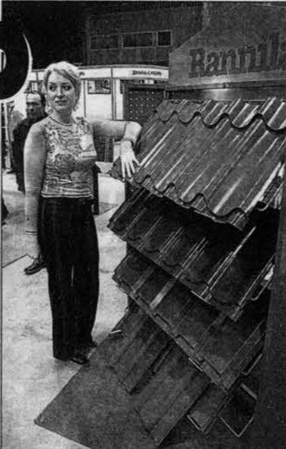
Металлочерепица - конек строителей.

Таких сюрпризов на выставке много. Познакомиться с ними можно не только во Дворце спорта, но и на площа-