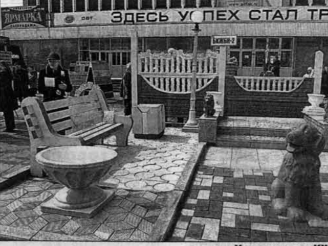
Уголок отдыха КЖБИ-2.

менты, используемые для внутренней отделки помещений. Первый раз участвуют в "Алтайской ярмарке" немецкая фирма "Lapp Kabel", представившая высококачественную кабельную продукцию, Новотроицкий завод кровельных материалов (Оренбургская область), предлагающий покрывать крыши прочными эластичными и разноцветными материалами из серии изолон, и другие. Барна-