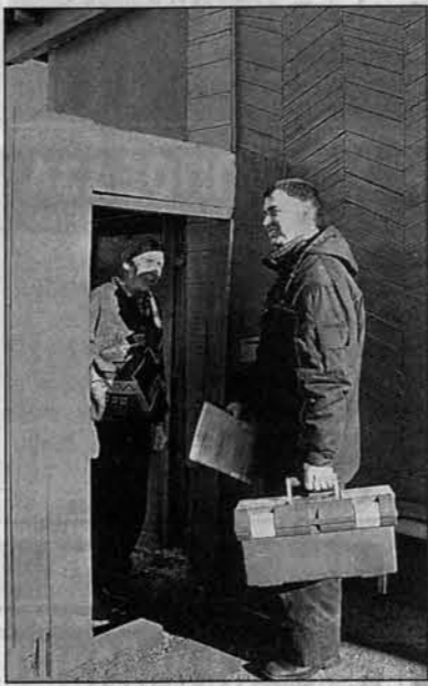
«Мастер, мы вас ждали!»

За семь лет работы на предприятии он стал таким мастером, что его поделом бояться капризничающие холодильники всех фирм и моделей. Особо