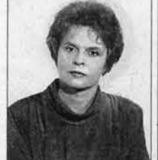
Публикуется на правах бесплатной политической рекламы.

Предлагаю вам четыре года совместной работы по защите ваших прав и интересов. Мое кредо: За словом - дело. Не ждать, а действовать