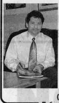
Публикуется на правах бесплатной политической рекламы.