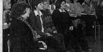
Хормейстер делится опытом с алтайскими коллегами.

- Почему же? У меня в лицее два коллектива. Хор маль-