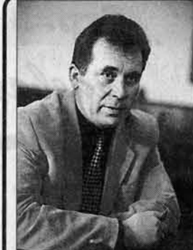
Публикуется на правах бесплатной политической рекламы.