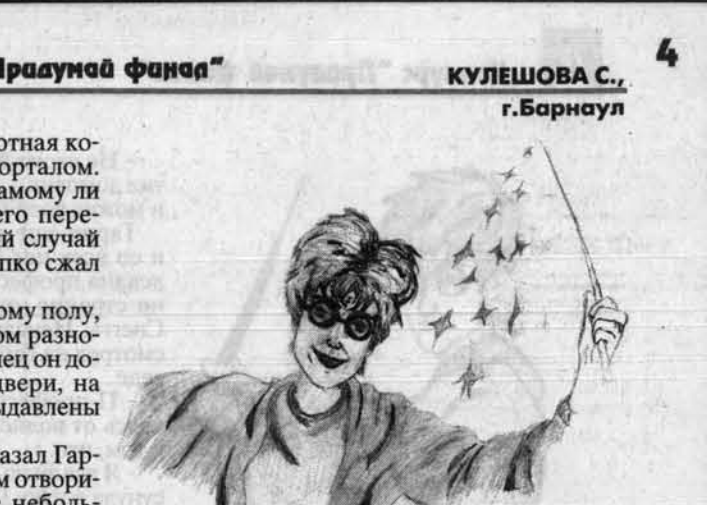
Рисунок Любы Яблонской, с Первомайское Бурилинского района.

Хвост - предатель, - сказал Гарри и смело посмотрел в лицо Волдеморта. Да, - подтвердил он, - но скоро ты поймаешь, Гарри, что предатели - это ценные люди.