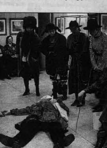
В спектакле, рассказавшем о нападении разбойников на купеческую дочь Ларису, было задействовано около десяти ряженных актеров. Чем бы они ни тешили нас, лишь бы было весело.

Женщина заспанным голосом спрашивает: «Кто?» - и одновременно открывает дверь. Увидев людей в масках, она опешила, частный дом, в котором проживает семья наших знакомых. Двери оказались не заперты, собака - на цепи. Чтобы не напугать хозяев (да и собаку тоже), начи