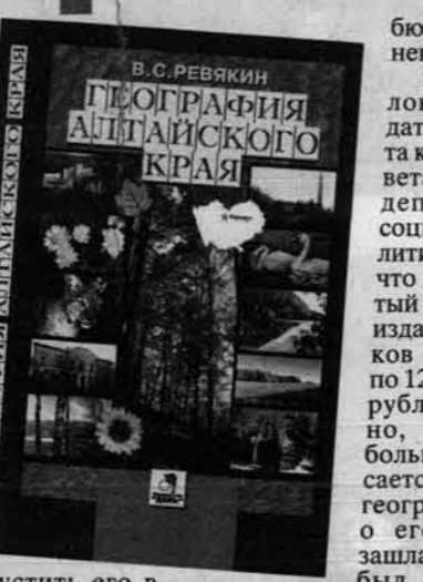
В.С. РЕВЯКИН ГЕОГРАФИЯ АЛТАЙСКОГО КРАЯ

- Рефлекс у животных - великая сила. Летом доим корову в станках, давая ей при этом кон-