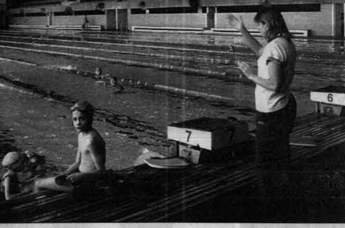
В бассейне спорткомплекса.