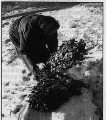
не отец сдвигал поездку дальше в июль. Я и сейчас не знаю, как он с точностью до дня определял срок. Но пока телешеств в телеге вдоль реки шесть-восемь километров до известных нам безбрежных зарослей, он успевал объяснить: - Пока в рост идет лист, он крепко держится на ветке. Тут ее и срезай - такому веннику износу не будет. И в конце июля лист зеленый и сочный, но это обманка: он уже об осени залудался и слегка поспел в пятке. Такой веник только пару бань выдержит. А в начале августа срез - совсем бархато: не успеешь раз попариться - он уже не веник, а голик. Свои премудрости были и на месте. Березы с серыми мы сразу обходили. С плакущими или просто неравномерными отростками - тоже. Но вот вроде бы идеальные березы - веточки одна к одной. Сложи их в кучку

Отца попарю, он меня - и до следующего его захода норолью быстренько помыться и... смыться. Но не всегда успевал. Плещет он на каменку, отшатнувшись от струи... Мать честная! Опять вся спина в саже - начинай по новой. Поэтому позже с радостью помогал отцу ставить баньку «по-белому» - с трубой, вытяжкой, предбанником. И керосиновую лампу (стекло которой не знали как уберечь от нечаянных брызг) сменили на электрическую лампочку в безопасном уголке. Но и во время этой стройки отец, как всегда, выкроил время для «свищеннодействия», сказав: - Завтра поедем с тобой венничек резать. Чтоб выстали и утюром носом не клевал! УВЛЕКАТЕЛЬНО ЭТО - ВЕНИКИ РЕЗАТЬ. Налаживались мы с ними обычно в конце июня, но при запоздавшей вес-