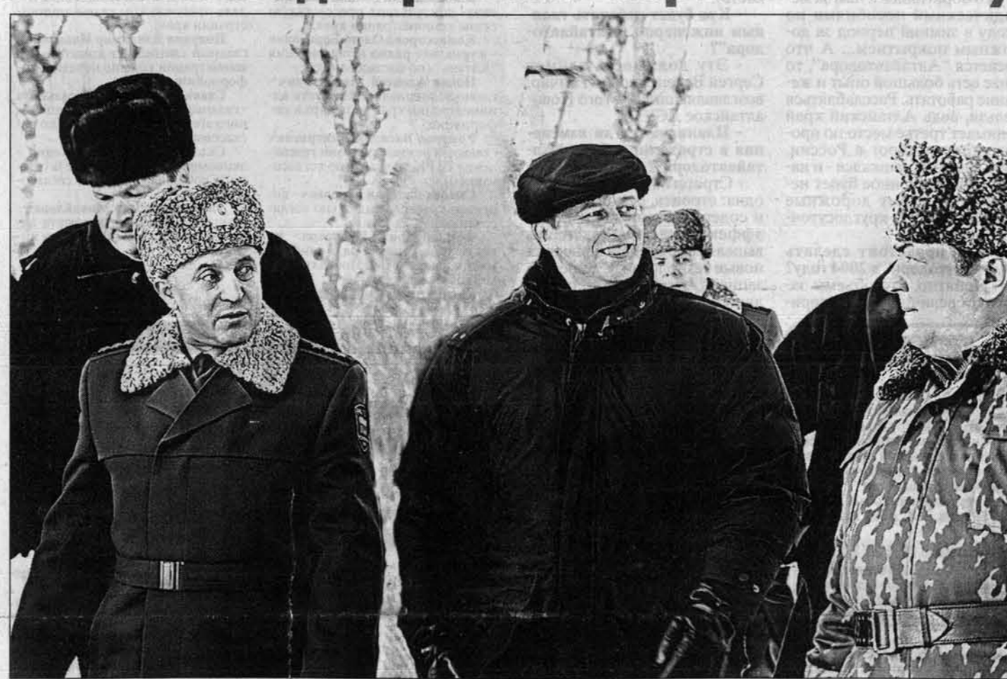
В Алейске Сергей Иванов прилетел с опозданием на 45 минут. Из вертолета он вышел с улыбкой на лице, а после проверки дивизии его настроение еще больше улучшилось.

В этом году "Снежный десант" побывает в Егорьевском, Угловском, Змеиногорском, Рубцовском районах. Организаторы акции - комитеты администрации края по делам молодежи, по физической культуре и спорту, краевой штаб студенческих отрядов, вузы.