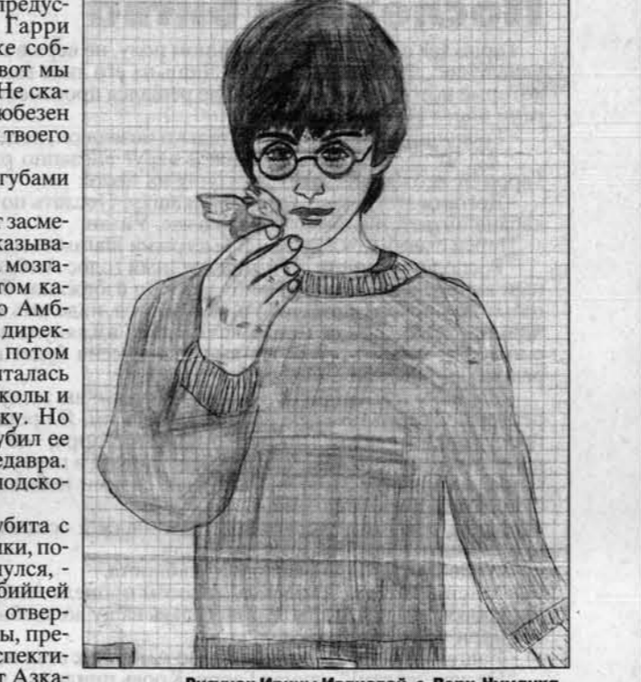
Рисунок Ирины Ивановой, с. Верх-Чуманка Беевского р-на.