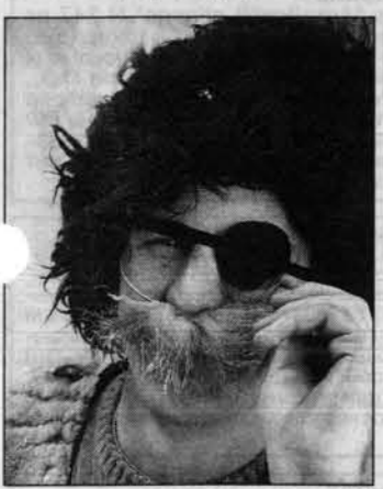
Признаемся честно, по стечению обстоятельств с наших колядок получились только один более-менее качественный снимок. Чтобы исправить положение и дать представление читателю, как выглядят колядки, мы напросились на святочную вечеру Барнаульского фольклорного ансамбля «Беловодье», выступавшего в Краевом художественном музее. И автор этих строк на минуту преобразился в атамана!

Как выяснилось, коляда - дело нехитрое только на первый взгляд. Прежде чем выйти «на заработки» (а основная задача колядующего не только хорошо повеселиться, но и собрать побольше подарков), нужно основательно подготовиться. Первым делом необходимо найти тексты колядок. Они бывают разные. Одни рассказывают о рождении Христа-младенца, о крещении и повитии его Пресвятой Девой, о волхвах, об Ироде, о святом Василии. Другие воспевают солнце, месяц, грозу; третьи - известных князей и народных героев; четвертые просто величают хозяйина и его семью.