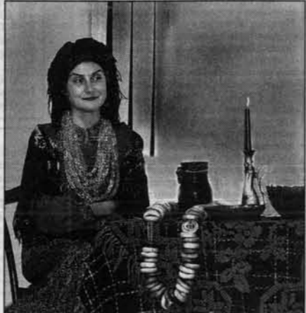
Хозяйка ждет ряженных.

Чтобы весело колядовать в городе, нужны три вещи - вместительная машина, хорошее настроение и сто граммов для храбрости. Время - около восьми вечера. В таком, мягко говоря, странном виде за хриплым напитком вся наша честная компания завалилась в магазин «Провинциалка», который находится на улице Георгия Исакова. Привидение в маске, волоча за собой шлейф накинута простыня, вошло первым, следом за ним остальные.