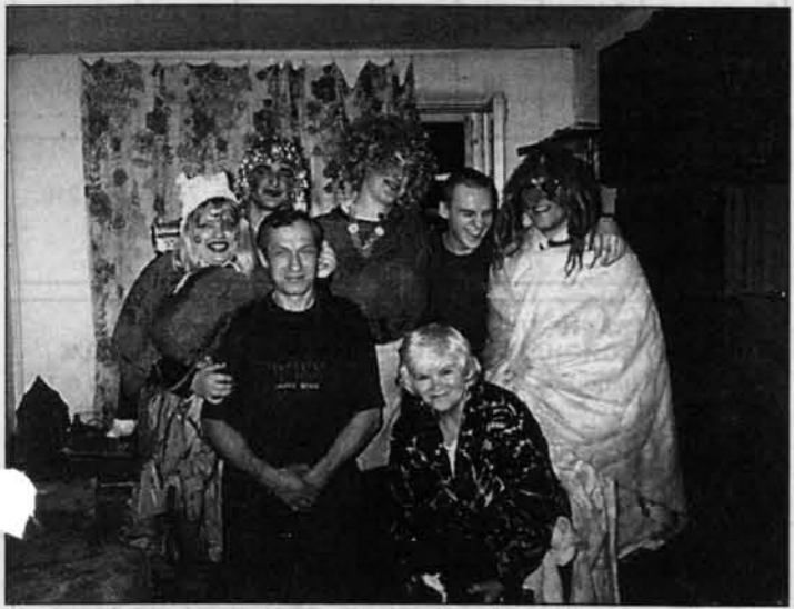
Готовность номер один: почти все уже нарядились.

Как известно, с Рождества начинаются Святки: двенадцать дней вилоть до Крещенского сочельника (18 января) на Руси издавна было принято гадать, рядиться, ходить по домам, поздравляя друг друга и желая счастья. Раньше колядующих встречали улыбка и подарками. А как сейчас? Чтобы выяснить это, мы нарядились в шутовские костюмы и пошли «сеять, сеять, посеять» по барнаульским домам и квартирам. И вот что из этого вышло.