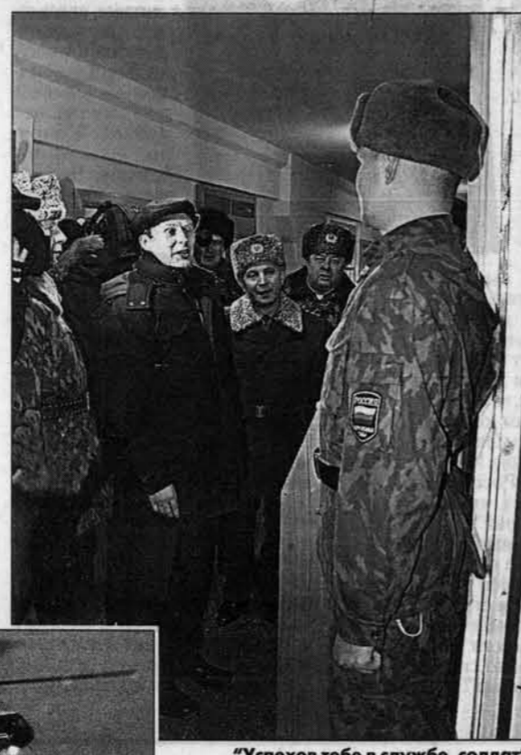
"Успехов тебе в службе, солдат".

По возвращении в Барнаул министр обороны и командующий Сибирским военным округом генерал-полковник Николай Макаров встретились с главой администрации края Александром Суриковым. Затем состоялась пресс-конференция с руководителями сибирских СМИ. С.Иванов начал с поздравления журналистов с их профессиональным праздником.