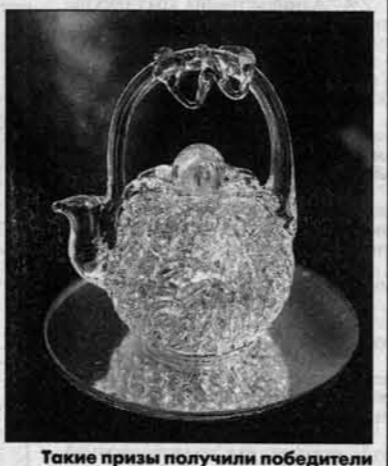
Такие призы получили победители конкурса "Времена года".

журнала. В этом году задумал сделать передвижную экспозицию прикладного искусства. Особенно нарядно выглядели камшковые куклы, сделанные ребятами из Змеиногорской художественной школы. В этом члены жюри усмотрели намек на возрождение традиционных народных промыслов, которые в перспективе могут способствовать развитию сувенирного бизнеса.