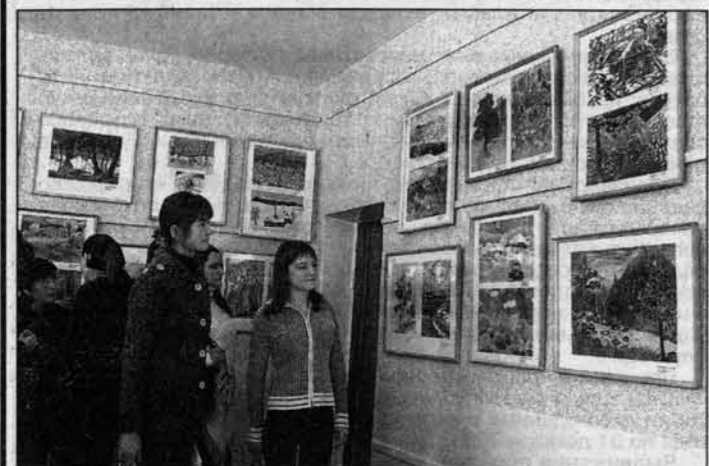
В выставочном зале: интересно, но что способны ровесники.