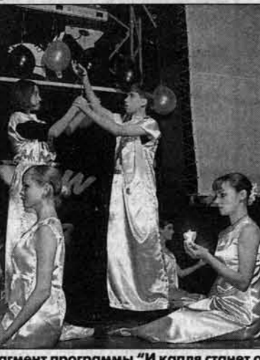
Фрагмент программы "И капля станет океаном..."

14 декабря собравшаяся в краевом Дворце молодежи 15-18-летнюю публику ждала неожиданность: вместо обычных танцев-"топтушек" была представлена концептуальная программа "И капля станет океаном..."