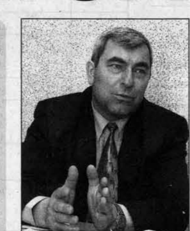
Справка "АП" Алтайская краевая общеобразовательная школа-интернат спортивно-олимпийского профиля в августе 1988 года была преобразована в училище олимпийского резерва по следующим видам спорта: лыжные гонки, биатлон, легкая атлетика, греко-римская борьба, борьба дзюдо, футбол, хоккей с шайбой, хоккей на траве, волейбол, спортивная гимнастика, бокс, фехтование, коньки, плавание.