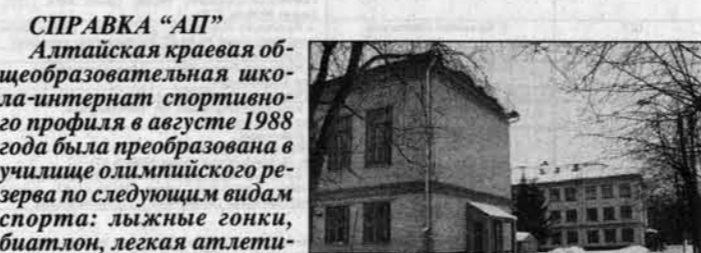
Справка "АП" Группы училища формируются из наиболее перспективных спортсменов, прошедших предварительную подготовку в ДЮСШ, в порядке конкурсного отбора и при прохождении углубленного медицинского осмотра. В училище принимаются школьники после 8 и 11 классов. Они получают среднее и среднее профессиональное образование с присвоением квалификации "педагог по физической культуре и спорту". Квалификационное образование происходит в условиях постоянно действующего учебно-тренировочного сбора.

млн. рублей на восстановление оздоровительного лагеря "Романтик", а всего для этих целей требуется не меньше 2,5 млн. рублей. Удалось включить училище в две целевые программы в области образования - о компьютеризации и укреплении спортивной базы. На этот счет есть распоряжение главы администрации края Александра Сурикова от 8 декабря. Такие вот основные итоги.