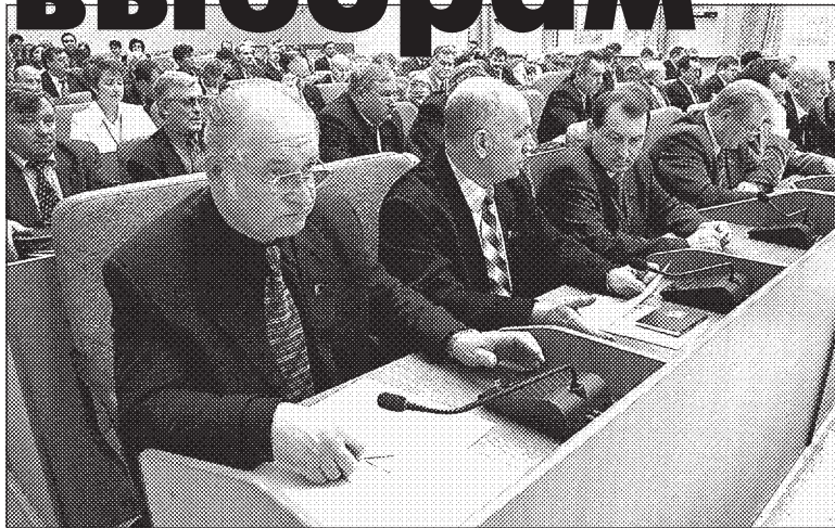
Постановление приняли единогласно.