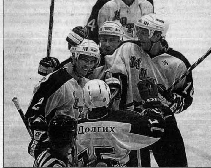
Выиграв в последнем матче первого круга в Кемерово у местной "Энергии" 1:0, барнаульский "Мотор" сам порадовался и своих болельщиков порадовал.

Завершился первый круг чемпионата России по хоккею в Восточном дивизионе среди команд высшей лиги.