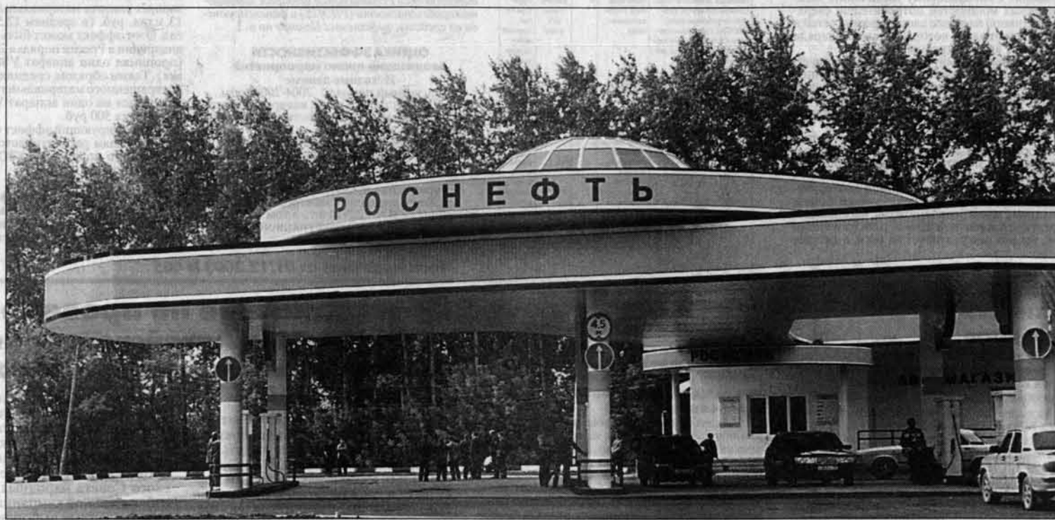
АЗС N 144 - одна из лучших на трассе Барнаул-Новосибирск.

Второй, не менее важный момент - обязательность в отношении с партнерами. Не сильно-то нам доверяли на первых порах. К счастью, эту психологию у потребителей удалось быстро сломать. Как результат, значительное расширение нашего спектра влияния на рынке нефтепродуктов Алтайского края - теперь наша доля составляет 19 процентов.