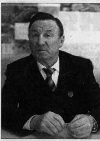
Фото Сергея Башлычева.

Виталий ДВОРЯНКИН, Евгений НАЛИМОВ (фото)