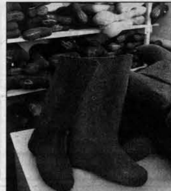
Валенки ручной работы самые теплые.

Взбитые валенки складывают в кучу и несут в "крокодильник". Прозвали этот цех так, потому