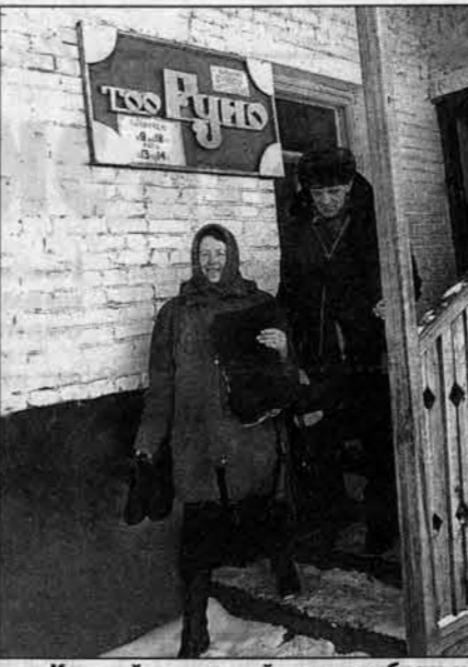
Каждый желательный может выбрать по пимокатие себе валенки.

довершию смотрю я на тридцатисантиметровую пяточку и примерно такой же носочек. - Конечно. У мужских голыш-ка еще больше. Да у нас тут много чего интересного. Как выяснилось, в этом цехе "наращивают" валенки. Из шерстяного "полотна" женщины выплетают форму, а потом "наращивают" ее как снежный ком. Напряжилось поучаствовать в процессе. Женщины меня отговаривают: "Руки замараешь". Но, чувствуя яростное желание уступить. На деревянный стол выкладываю огромную серую шерстяную лешку (это только потом валенки красят в черный). Из нее руками выплетается что-то вроде мешка, только в середине зауженного. Только шерсть лепилась лучше, ее поливают водой. Мне, как но-