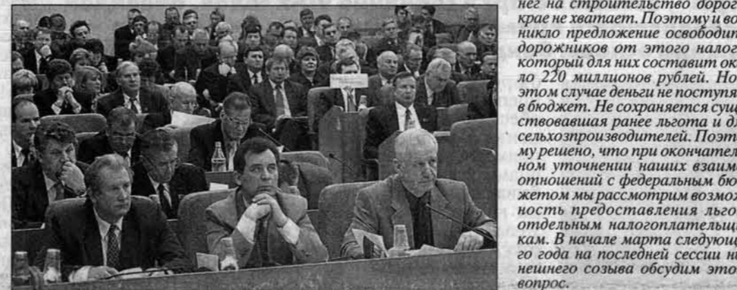
В зале заседания.

В окончательную повестку для 41-й сессии краевого Совета народных депутатов было внесено 34 вопроса. Даже без ознакомившись с содержанием предлагаемых к рассмотрению законопроектов, можно было предположить, что их обсуждение будет долгим и весьма горячим. Так оно, собственно, и произошло.