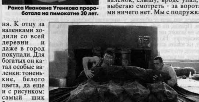
Даже мужчинам мять валенки тяжело.

Правда, работа эта была сезонная: заказы были поздней осенью и зимой. Вот однажды зимой мы после сиделок с подружкой и кавалерами пошли погулять. А мороз был градусов тридцать, вот мы и решили погреться на пимокате. В общем, засиделись мы до четырех утра, а в это время как раз отец на работу выходил. Слышим мы, кто-то идет, а женки наши испугались и сразу кинулись прятать