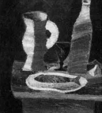
Ю. Яуров, "Три символа".

сте, туловище - в другом. А может и просто голова без туловища. Или лицо без головы. Поди ж ты разберись! Как не возмутиться рядовому зрителю? Линии на яуровских картинах тянутся куда-то без начала и без конца, плетут символическую мозаику. Знак в виде перечеркнутого крестом круга