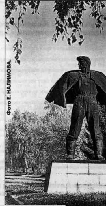
Помник первопоселенцам Алтая, установленный на ул. А. Петрова в Барнауле.

Это - из приветствия первого российского президента к 40-летию целины участникам международной конференции в Барнауле. Сейчас мы идем к 50-летию той эпопеи, которая была инициирована Алтаем и началась именно у нас, когда в ночь на 1 марта 1954 года в Барнауле прибыл первый в стране эшелон с первопоселенцами - посланцами Москвы и Московской области.