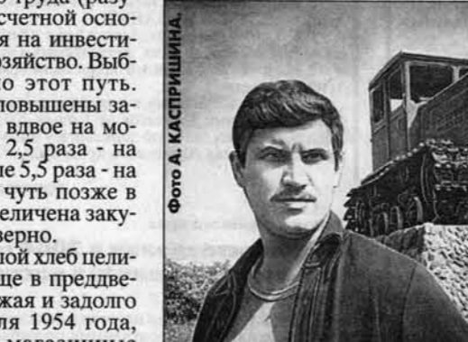
Целина в стране была поднята в основном тягачами производства Алтайского тракторного завода.

ДТ-54 (который был настолько неприхотлив, что его, как и автомобиль ГАЗ-51, и многую прочую технику, можно было отремонтировать на любом полеводстве). Зерновых ком-