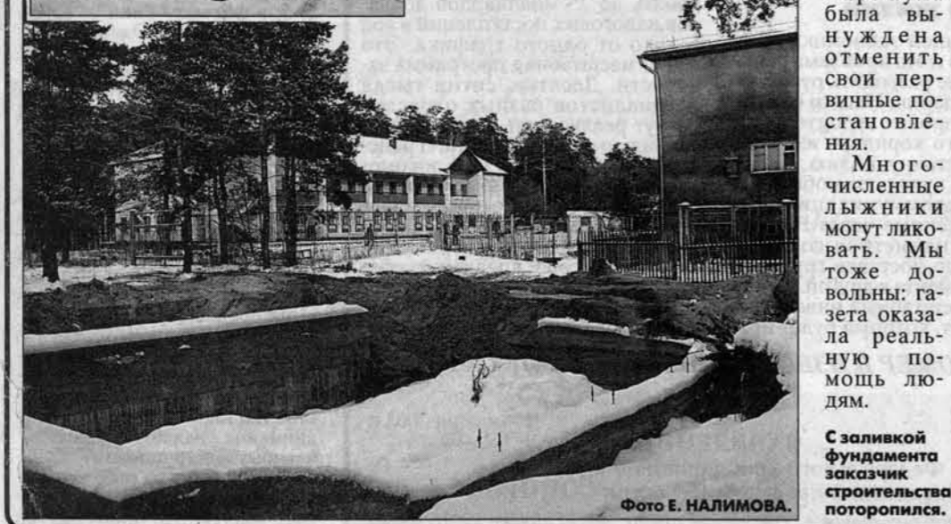
С заливкой фундамента заказчика строительство поторопилось.