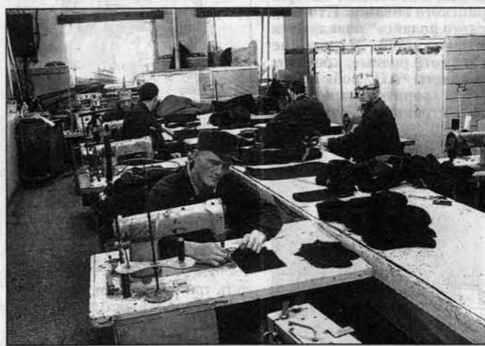
В тюрьме можно стать модельером.

На первый взгляд тюремный дворничек не отличается от заводского. Об особом статусе учреждения напоминают лишь многометровый забор с колючей проволокой и антитеррористические "ежи", расставленные повсюду на тот случай, если имеются