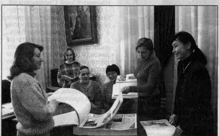
Сотрудники музея оформляют книгу "Летопись материнского подвига".