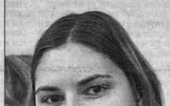
Викка, АГУ, географический факультет: - Я думаю, за кого голосовать, разрываясь между "Единой Россией" и СПС.

предполагалось провести почти во всех вузах Барнаула: - Нам прежде всего интересуют настроения молодежи. Правда, о проведении акции удалось договориться только с АГМУ, АГИИК, АГУ и исто-