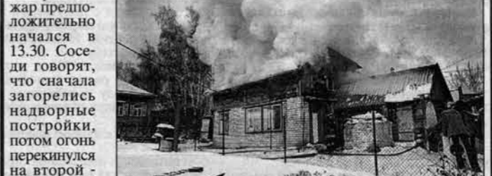
Деревянный этаж выгорел изнутри.

Вчера, 19 ноября, в Барнауле загорелся двухэтажный частный дом. Дом стоит неподалеку от Покровского собора. Пожар начался в 13.30. Соседи говорят, что сначала загорелись надворные постройки, потом огонь перекинулся на второй - деревянный - этаж дома.