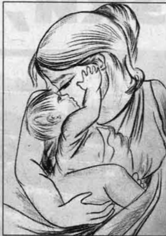
Мать и дочь.