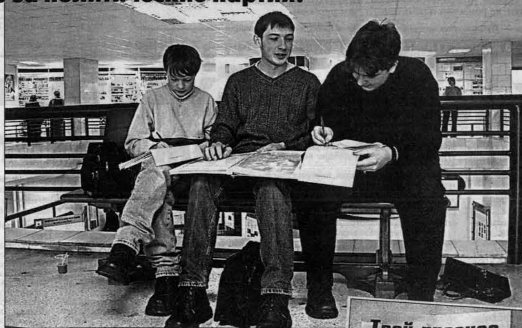
Голосование, даже "нарощенное", - дело ответственное!

рическим факультетом БГПУ. Руководство остальных вузов отнеслось к идее настороженно, все спрашивали нас: "Для чего это?", "Как это будет использоваться?" Да просто будет использовано: выставим в Интернет, дадим людям информацию, на основе которой они будут делать свои выводы.