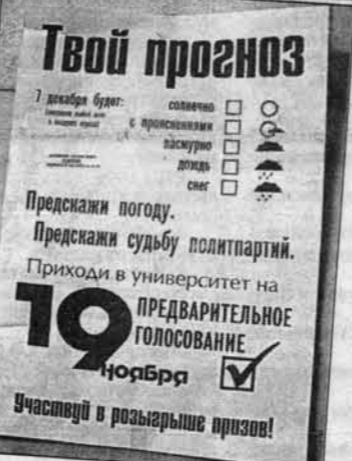
Для лучшей активности всем участникам акции были обещаны призы.

У нас о молодежи судят по стереотипам - она неактивна, не умеет выбирать, пьет, курит, ходит в ночные клубы. Мы надеемся, что эта акция покажет, что молодежь достаточно активна, просто работать с ней надо нестандартно, так, как интересно молодому людям. Кстати, 18 ноября мы провели голосование среди тех 50 человек, которые сейчас работают на акции "Сегодня я выбираю". Уже тогда выяснились интересные вещи: многие просто не знают, как голосовать! Спрашиваю, надо ли расписываться... Многие партии молодым людям просто неизвестны.