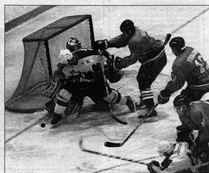
Жарко у ворот гостей.