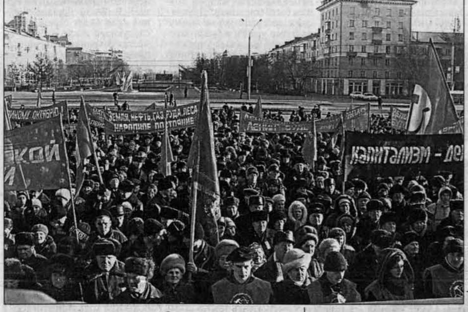
Молодежь на митинг НПСР. Комсомольцы принесли макет "Авроры".