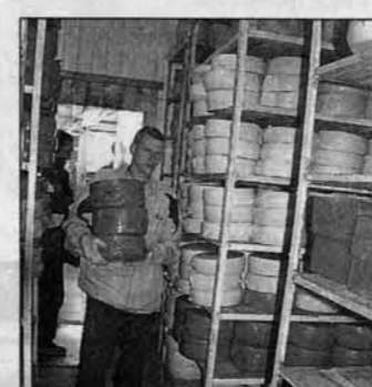
В этом холодильнике налетчики собирались запереть работников "Модуль". Температура здесь такая, что дожить до утра смогли бы не все...