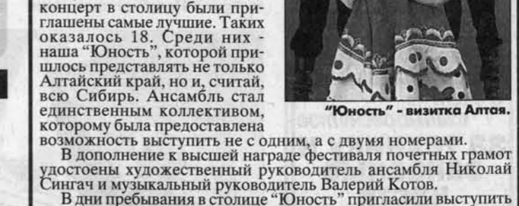
"Юность" - визитка Алтая.