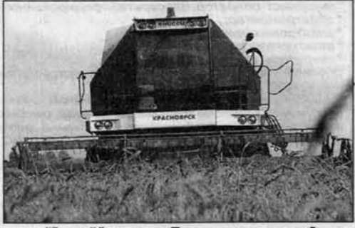
"Енисей" на полях Поспелихинского района.

Алтайские механизаторы на практике доказывают, что при эффективной эксплуатации комбайнов "Енисей" можно добиваться рекордных результатов и собирать богатый урожай в сжатые сроки и с минимальными потерями.