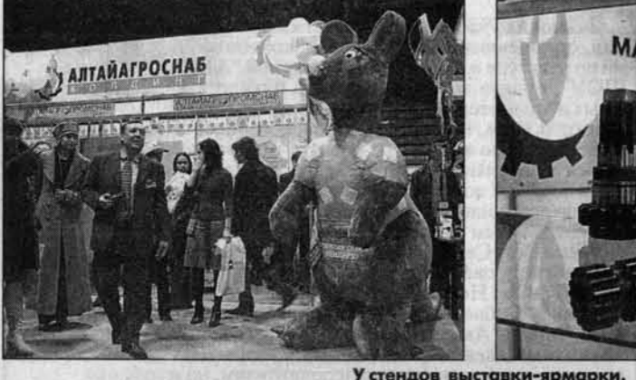
У стендов выставки-ярмарки.

сельского хозяйства. Все это также свидетельствует о признании успехов зернопереработчиков края. Хотя на весь агропромышленный комплекс Алтай налагает и дополнительную ответственность. Плана успехов и достижений поднята на очень высокий уровень. И очень важно в будущем ее удерживать. Торжественное мгноение. Разрезана традиционная красная лента, и теперь самое время ознакомиться с тендами выставки. Вот "Алтайагротех-Холдинг". Если смотреть номинально, то эта фирма - практически дебютант