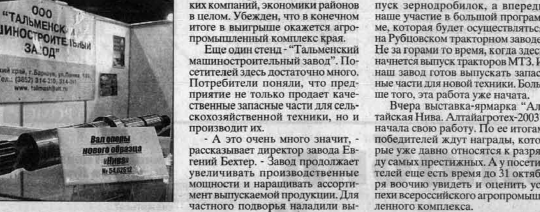
У стендов выставки-ярмарки.

"Честный бизнес" Налоговики применяли и "кнут", и "пряник" Краевая налоговая акция "Честный бизнес" помогла выявить организации и предпринимателей, уклоняющихся от уплаты налогов, разъяснить важность повышения правовой культуры налогоплательщиков. По сообщению пресс-службы межрайонной ИМНС РФ, по крупнейшим налогоплательщикам Алтайского края в рамках акции проведен 291 рейд, проверена деятельность более 600 предпринимателей и по выявленным нарушениям предусмотрено штрафов на сумму 337 тысяч рублей. На работающие в рамках акции "телефоны доверия" поступило 74 сообщения от населения (о сокращении реальной заработной платы, о нарушениях закона о предпринимательской деятельности и т.д.) и в половине случаев полученная информация подтвердилась. В налоговых инспекциях прошли дни предпринимателей, здесь побывали экскурсиями барнаульские старшеклассники, во Дворце