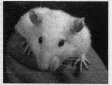
А такую белюсочку можно и любить.

то чаще всего называют крыс), и диву даешься, какие у них теплые отношения со своими зубастыми питомцами.