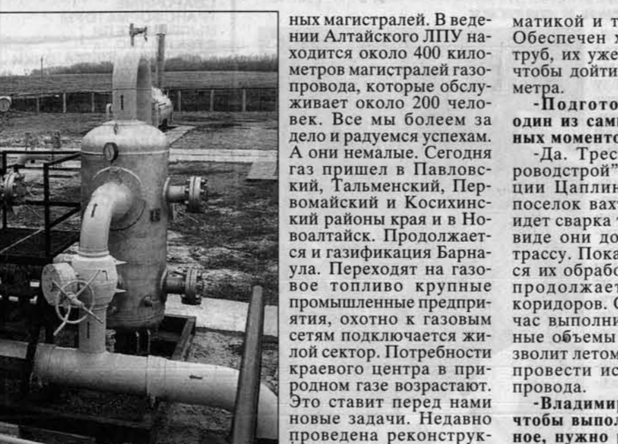
На ГРС-1 рабочая обстановка.

В состав "Томсктрансгаза" 16 структурных подразделений, расположенных в пяти субъектах Российской Федерации.