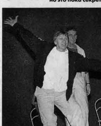
"Делайте, как я, делайте лучше меня!"

искал форму и художника. И нашел - это омский сценограф Виктор Акимов. Я сначала хотел танцевальные номера и костюмы делать а-ля Юлашкин и музыку арранжировать в эстрадном стиле. Но потом понял, что время обнаженной плоти на театральной сцене прошло! Более того, эта "эстетика" опустылила! И мы решили сделать оформление в стиле "желез" - легкое, ажурное. А московские гости будут "работать" в стиле "хохлома". Костюмы обалденные получились!