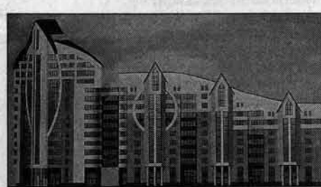
Фасад комплекса "Анастасия".

Сам "небоскреб" возведут по улице Папанинцев напротив магазина "Хороший". Рядом с ним встанет вторая башня - в 14 этажей. Дальше комплекс повернет на проспект