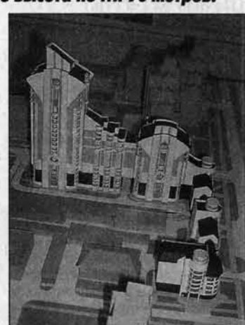
Небоскреб не закрывает две башни, доминирующие на проспекте Красноармейском.

Весь архитектурный ансамбль "Анастасия" будет оформлен в серо-синих тонах. Последние два этажа - технические помещения. Дом будет монолитным. (Как утверждают специалисты, кирпичные здания нельзя строить выше 16 этажей).