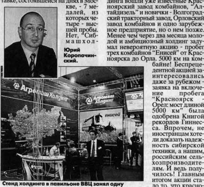
Стенд холдинга в павильоне ВВЦ занял одну из самых больших площадей.

В последнее время на страницах газет замелькали новые, но где-то знакомые названия - "Агромашхолдинг". Напоминать хорошо извест- ное на Алтае открытое акционерное общество "Сибмашхолдинг", пра- ва? А все потому, что "Агромаш- холдинг" является полным и пол- ноправным преемником "Сибмаш- холдинга". В том числе и в тради- ции побеждать. Итог показа сель- хозтехники холдинга на главной рос- сийской агропромышленной вы- ставке, состоявшейся на днях в Мо- скве, - 7 медалей, из которых че- тыре - высшей пробы. Нет, "Сиб- ма" а ш о л д и н г