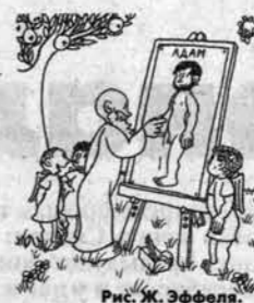
Рис. Ж. Эфенди

Подпишись, не уппусти время. Для жителей Барнаула: если ваш почтовый ящик в таком состоянии, что газету там не выживают, оформите подписку в киоске "Роспечати" - вы сможете забирать свою газету в любое удобное для вас время.