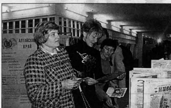
Рабочий момент конференции.