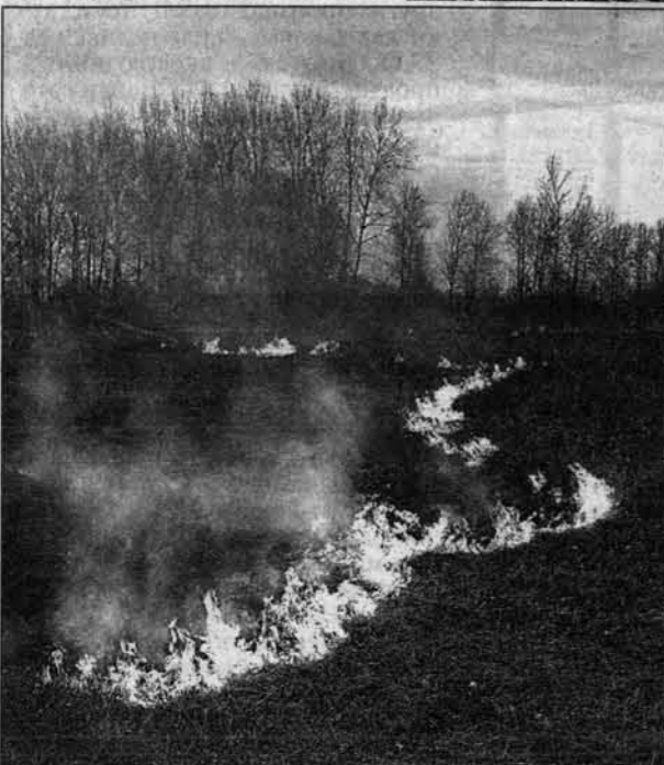
В окрестностях села Николаевка.

Справка "АП" В октябре 1998 года на Алтае произошли сильные лесные пожары. В Угловском районе в дыму и огне погибли 16 человек. Осень подходила к Барнаулу, на ликвидацию пожара были брошены силы Барнаульского пожарного отряда. Тогда сгорела деревня Малая Речка. В этом случае жертв удалось избежать. Погорельцам были выданы компенсации, на которые часть людей купила дома в других деревнях, но некоторые, наиболее упорные, открыли новые дома на том же месте.