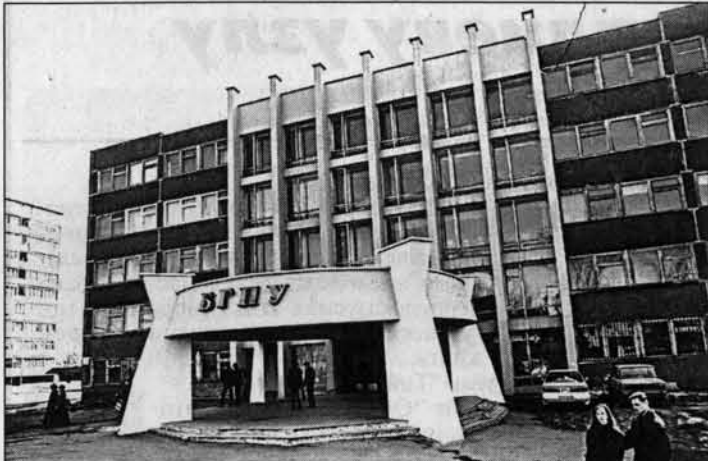
Главный корпус БГПУ.

Практически все вузы края имеют в преподавательском составе выпускников БГПУ. Даже медицинские, где они работают на кафедре физики. За 70 лет университет подготовил около 60 тысяч специалистов, так что в целом влияние его на уровень образования в крае трудно переоценить. Даже если не все выпускники стали педагогами, обществу получило хорошо образованных людей. Среди них, кстати, немало тех, кто трудится в у-