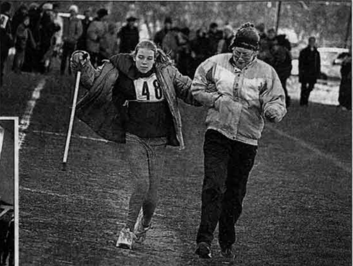
Смелее, девочка моя! Смелее!

На барнаульском стадионе "Трансмаш" 13 октября прошла кровавая спартакиада для детей с ограниченными возможностями.