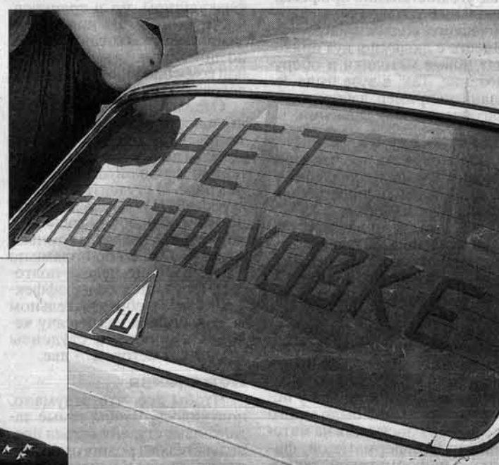
Так некоторые водители выражали свое отношение к "автогражданке".

Ситуация сейчас очень неясная. Введение моратория оставит миллионы автовладельцев в подвешенном состоянии. Например, страховаться уже вроде и не надо, но техосмотр без страхового свидетельства по-прежнему не пройдет. А тех, у кого сроки техосмотра просрочены, сотрудники ГИБДД будут штрафовать. Точно так же, без страхового свидетельства, автомобиль нельзя поставить на учет и снять с него.