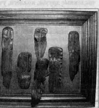
Мастерская резьбы Владислава Хромова: пластика из кедровой щепы - «Саргатай»

Надеюсь, что можно, хотя это очень трудно. Это как озоновые дыры, которые все расширяются и расширяются. Эти большие участки «земли» необходимо заполнять знанием, но это знание ежесекундно ежеминутно утрачивается. Уходят из жизни старейшие алтайские сказители и премирники практически не оставляют.