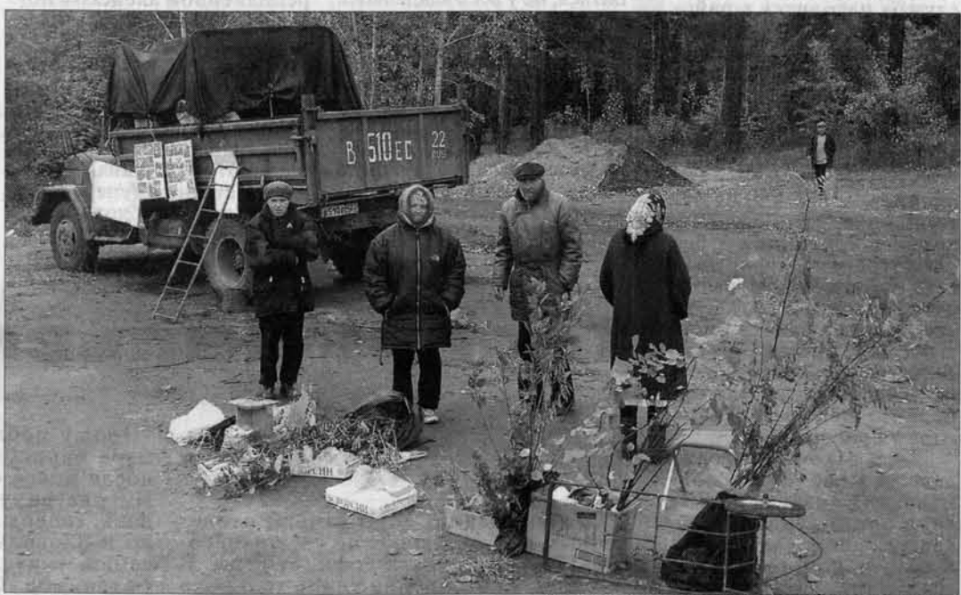
Конкуренцию, как всегда, составляют частники.

Кстати, кроме Барнаула, наиболее известные питомники находятся в Бийске, Алтайском и Змеиногорском районах, Благовещенске, Родино, Волчихе, Чемале и Бахчаре.