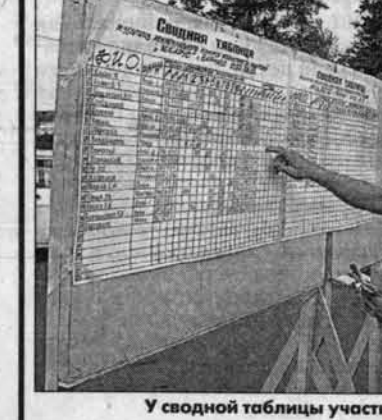
У сводной таблицы участники конкурса с волнением ждали предварительных результатов.

Опытные автомобилисты нам объяснили: "Конечно, есть некоторые физические факторы, которые могут повлиять на успех водителя, например, широмонтаж, расточка двигателя, но на хорошем, ровном и сухом асфальте (именно такой на площадке у Дворца спорта) они практически не действуют, поэтому всем конкурсантам оста-