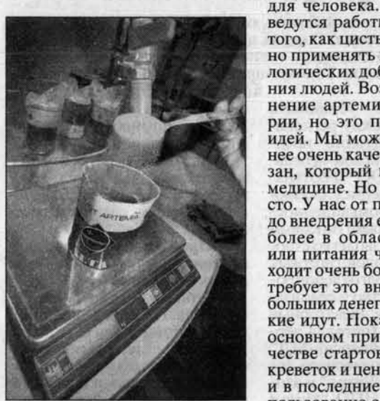
За kilo артемии - 5 долларов.

- Прибыли были такие великие, как в 2000-м, когда американцы временно прекратили поставку яиц артемии на мировой рынок? - Да, У нас отличная лаборатория, очень хорошая переработка, поскольку предприятие размещено прямо на берегу и возможности промыть просто неограниченно. Промываем рапидом в естественных условиях. Везти сюда ничего не надо, все на одном месте. Сушка у нас неплохая. Хотят и сделана своими руками.