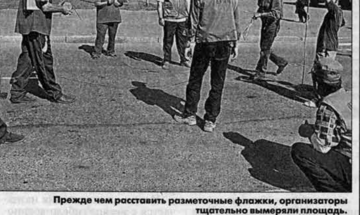
Прежде чем расставить разметочные флажки, организаторы тщательно вымеряли площадку.

команды Красноярска, Кемерово и Барнаула. Соревнования проводились в