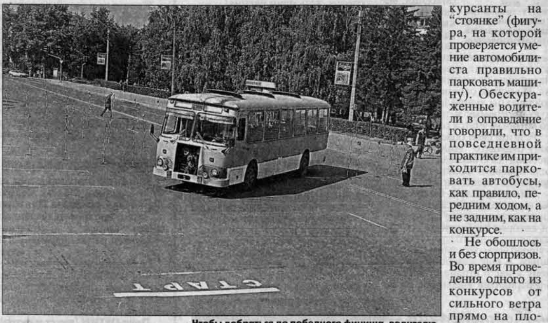
Чтобы добраться до победного финиша, водителю надо выполнить восемь сложных фигур.

Традиционный конкурс сибирских автомобилистов нынче впервые проходил в Барнауле. Организаторами выступили администрация города и края, межрегиональная ассоциация автомобилистов и ассоциация "Автомобильные перевозчики Алтая". В состязании участвовали команды из Красноярска, Хакасии, Тывы, Алтайского края (наш край выставил сразу две команды "Алтай-1" и "Алтай-2"), Томска, Кемеровской, Павлодарской и Новосибирской областей.