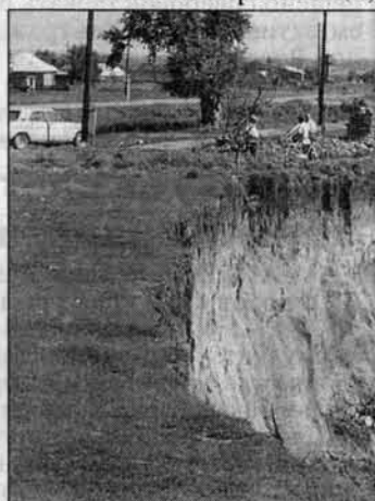
Берег Чарыша в селе Бестужеве.

Вывод напрашивается один: необходимы большие средства, чтобы повернуть течение реки в нужном направлении. Согласно проектно-сметной документации, разработанной "Алтайводпроект" по заказу Главного управления по природным ресурсам, чтобы отвести реку от села, нужно 20 миллионов рублей, а спасение Чарышского водопровода обойдется в 50 миллионов. Средства большие, но ведь и проблема серьезная. Достаточно сказать, что чарышскую воду получают в 9 районах. Последствия вывода из строя водопровода трудно даже представить. Не хочется думать и о том, что в Бестужеве появятся новые переселенцы.