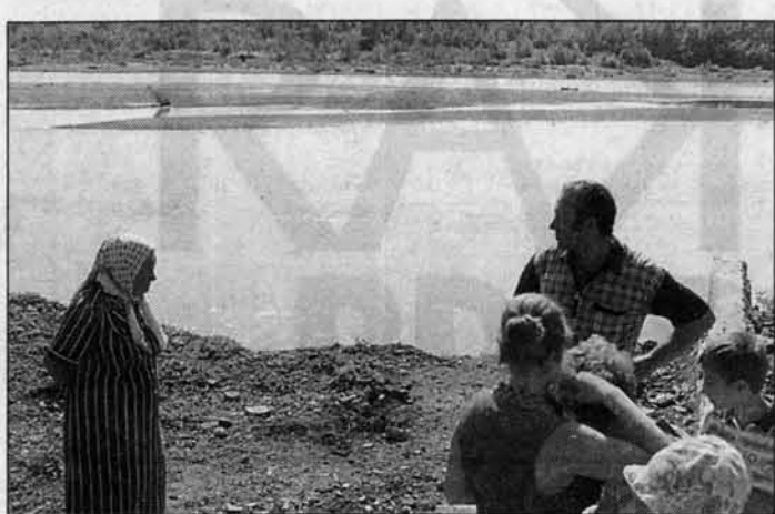
Там, где течет вода, была улица.

а село останется без школы, клуба, магазина... Проблемы бестужевцев находятся под пристальным вниманием краевой администрации. Благодаря ее материаль-