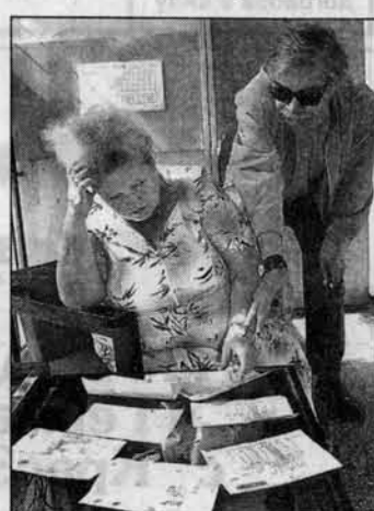
Наконец показываю оператору справку из ЖЭУ, называя свой адрес.

Некоторое время назад изменилось количество людей, прописанных в нашей квартире. Было три человека, стало два. Я позвонила в водосбыт (пр. Ленина, 120) и попросила оператора отметить это изменение в квитанциях. Ведь за воду мы платим с человека. "Сначала принесите справку из ЖЭУ о количестве проживающих в квартире", - потребовали у меня.