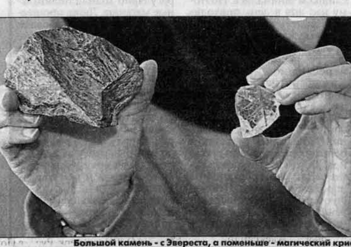
Большой камень - с Эвереста, а поменьше - магический кристалл силы.