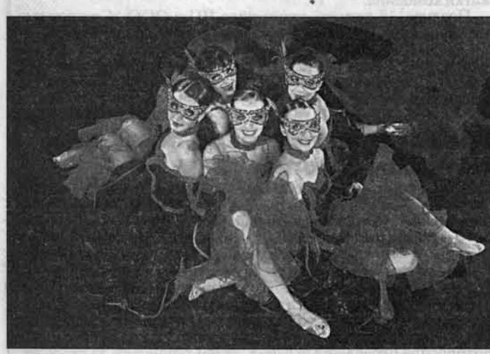
Девочки студии "Лариса" — какой цветник!

С 3 по 9 августа в Праге прошел международный молодежный фестиваль, организованный Всемирной молодежной организацией ("YMCA"). Студия спортивного и бального танца "Лариса" из Барнаула танцевала в Праге за всю Сибирь! На фестиваль собрались представители из 40 стран мира. Только официально зарегистрированных участников было шесть тысяч, из них — 300 человек из России. Правда, почти все из столиц (Москва, Санкт-Петербург) да из Центральной России. Из-за Урала были "Лариса", театр из Новосибирска и школа моды из Бердска. Фестиваль был устроен в честь 30-летия европейского альянса "YMCA", а вообще эта крупнейшая в мире молодежная организация суще-