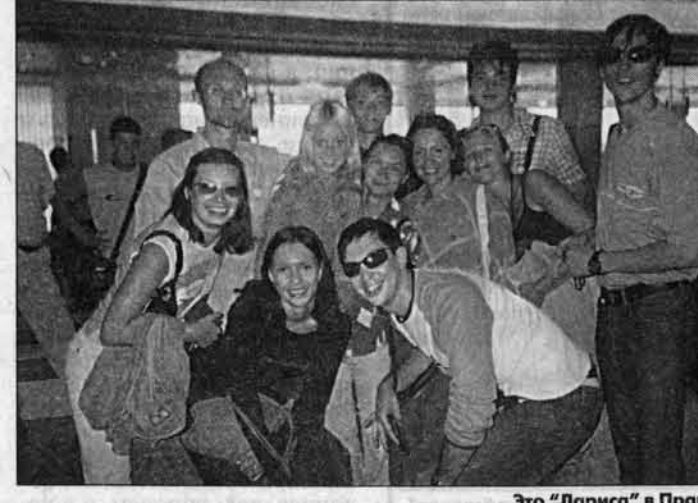
Это "Лариса" в Праге.