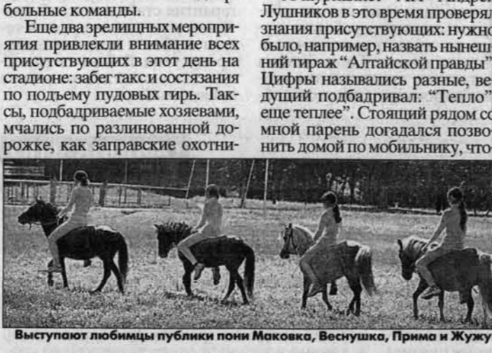
Выступают любимцы публики пони Маковка, Веснушка, Прима и Жуку.

бы родные подсказали ему тираж, заглянув в газету. К его огорчению, дома никого не оказалось. И все же с максимальной точностью тираж (более 72 тысяч экземпляров) назвали ребята из команды "Соборная". (Окончание на 3-й стр.)