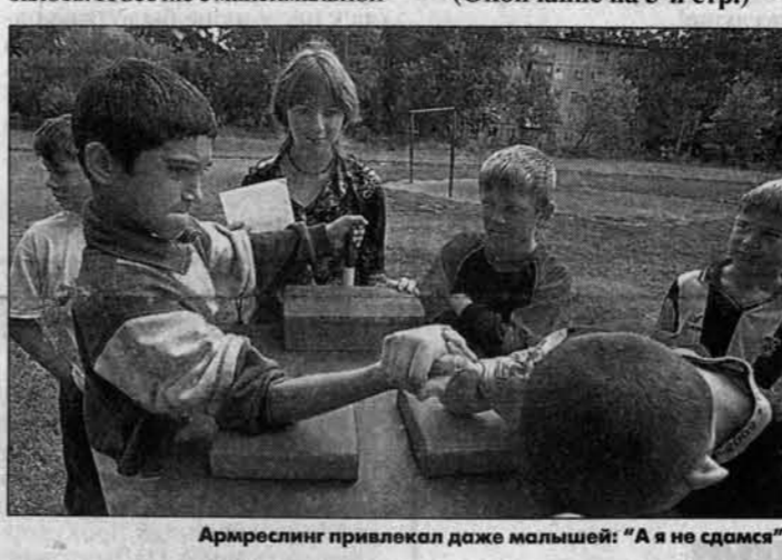
Армрслинг привлекал даже малышей: "А я не сдамся".