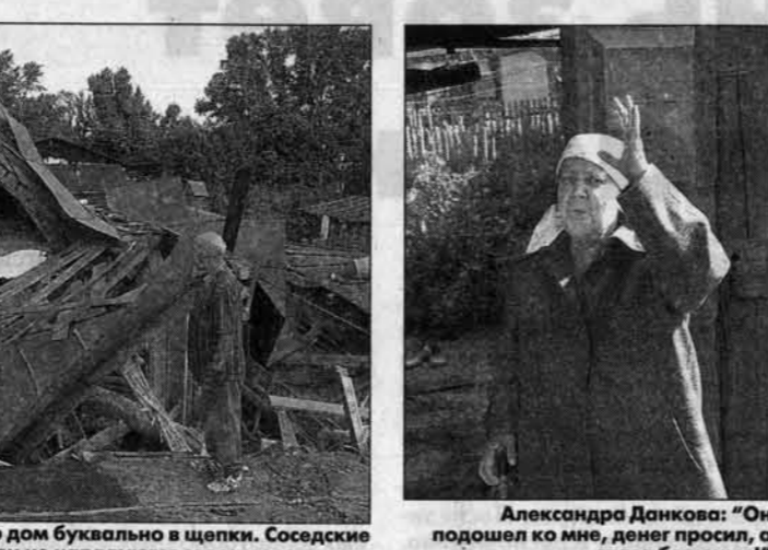
Взрыв разметал крепкий в общем-то дом буквально в щепки. Соседские дома стоят вплотную, так что соседи не народуются своему везению...