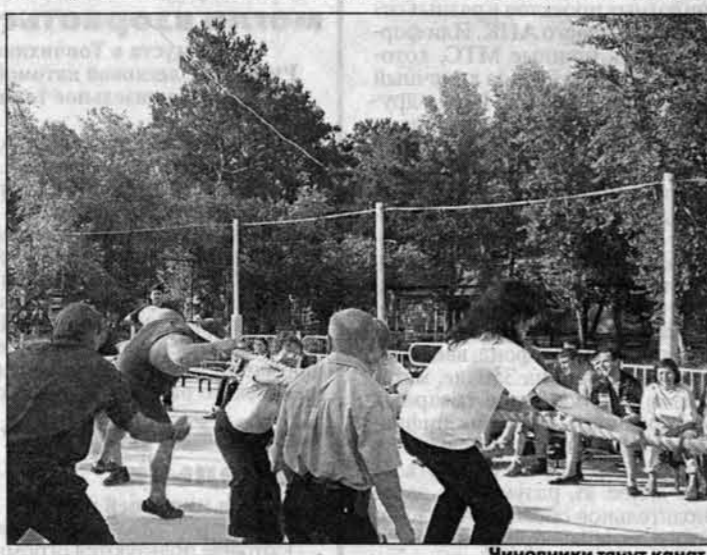
Чиновники танцуют канат.

2 августа в детском лагере отдыха "Юность" (Егорьевский район) прошел краевой слет студенческих строительных отрядов.