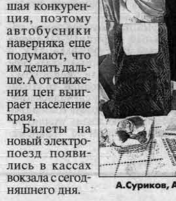
А. Суриков, А. Назарчук и А. Целько осматривают вагон первого класса.

на постоянном, и на переменном токе. Билеты на поезд стоят относительно недорого - от 141 до 170 рублей. В электричке 220 посадочных мест - 96 в первом классе и 124 - во втором. Из Барнаула поезд будет отправляться в семь часов утра, из Новосибирска - в 16.55 (время местное). Глава администрации края Александр Суриков, осмотрев поезд, сказал, что это настоящий подарок для пассажиров. - Немаловажно, что электричка будет рентабельной, комфортабельной и в перспективе станет более скоростной, - отметил он. - Еще мы бы хотели поработать в этом плане с железной дорогой над поездами дальнего следования. Главу поддержал председатель краевого Совета народных депутатов Александр Назарчук: - Сейчас на этом рынке боль-