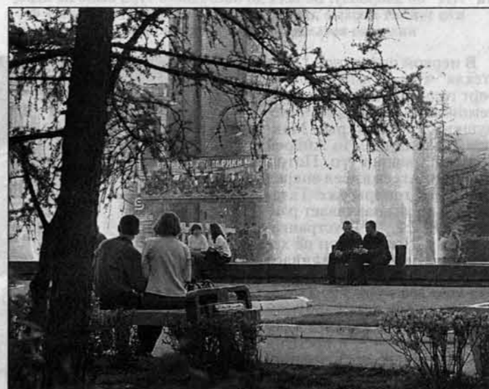
Мы не подозреваем, что, возможно, уже числимся в рядах какой-нибудь партии...

Мы привели далеко не все партии, зарегистрированные в нашем крае. И причина не в том, что мы кому-то симпатизируем или нет. Просто многие из них уходят с политической арены так быстро, что за нами просто не успевают. Вот мы и подумали, а может, и не надо за ними больше гоняться?