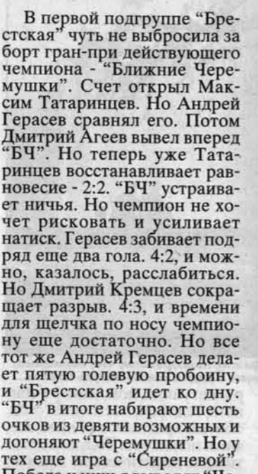
"Брестская" - "Ближние Черемушки".

Два мастера ООО "ТелВид" подключили к кабельной сети телевизор автора этих строк: на 10-й кнопке можно смотреть федеральный канал "Спорт", а на 12-й - "ТВ".