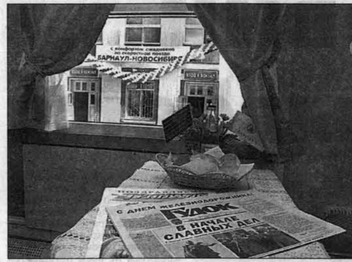
В купе нового поезда.