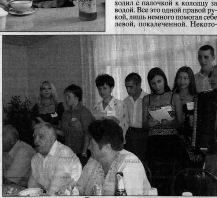
Песня для деду в исполнении хора внуков.