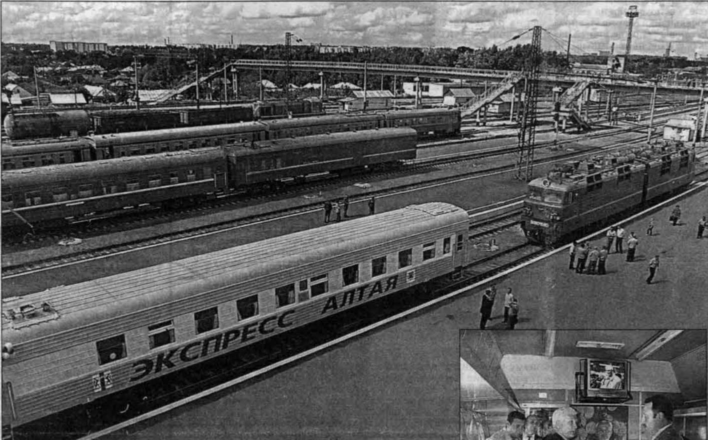
Тот самый скоростной поезд. Расстояние от Барнаула до Новосибирка в 228 километров он преодолевает меньше чем за четыре часа.