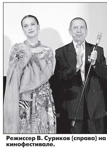
Режиссер В. Суриков (справа) на Шукшинском кинофестивале.

Раскрутка, абсурд, разочарование. Пожалуй, эти слова характеризуют "Кострому" как нельзя лучше. Именно они чаще всего срываются с уст зрителя после фильма.