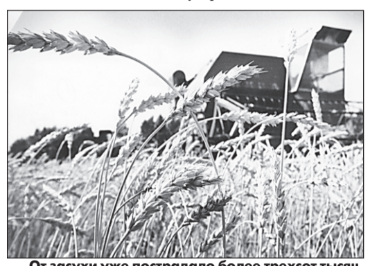
От засухи уже пострадало более трехсот тысяч гектаров.

краевого сельхозуправления, говорит: Жара стояла весь май и июнь, так что дожди в середине июля уже не помогли району на западе края. Если не будет дождей, то в этих районах уборочная начнется в конце недели. А на следующей неделе - по всему краю... Кроме того, в последние дни июля в ряде районов края уже начался процесс загнивания зерновых культур. По подсчетам специалистов, в ряде районов края уже и уборки не будет, на других участках собрать самое большее 5-6 центнеров ста. Изя за жары на полторы недели раньше наступило созревание хлебов, так что