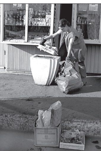
Из таких урн мусор приходится выгребать руками. А это не только противно, но и опасно.