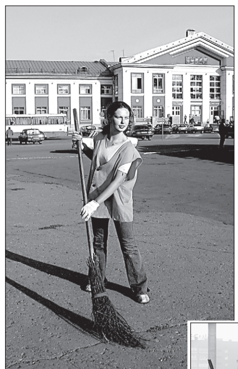
Широка страна моя родная!

Эти 1672 человека делают Барнаул чистым каждое утро