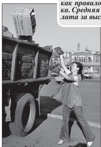
Погрузка хорошо заменяет гимнастику.