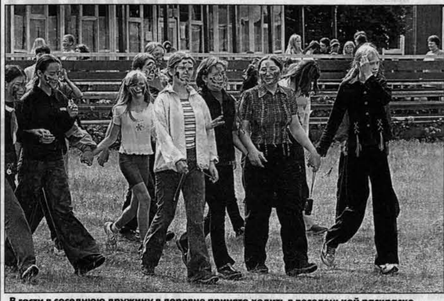
В гости в соседнюю дружину в деревне принято ходить в веселенькой раскраске.

Десятый год подряд Краевой союз детских и подростковых организаций приглашает детей со всего земного шара в Международную летнюю детскую деревню.