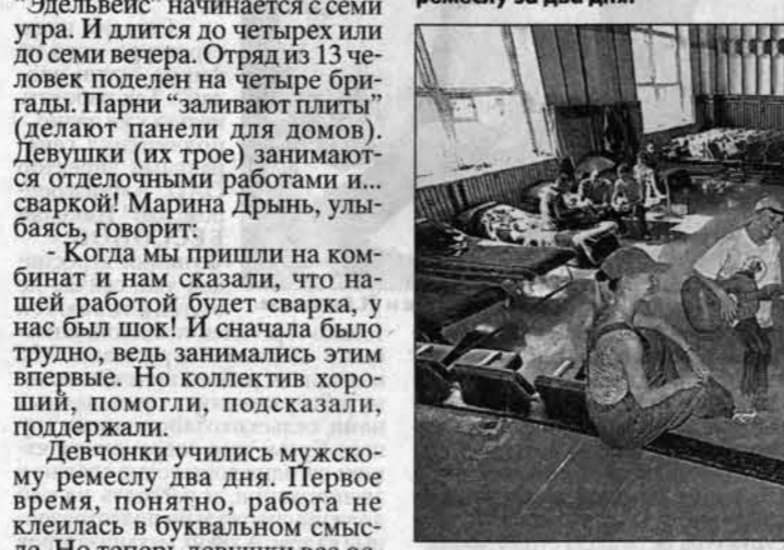
И, конечно, отдыхать лучше хором.

Последние новости В Москве определены окончательный состав жюри и ведущие проекта телеканала РТР "Народный артист". В жюри вошли народная артистка России Лариса Долина, радиоведущий Антон Камолов, режиссер Тигран Кеосаян. Председатель жюри - известный продюсер Евгений Фридлянд. Первый отборочный тур шоу прошел в Москве, Волгограде, Перми, Красноярске. Второй тур "Народного артиста" пройдет в Москве с августа. На ТВ "Народного артиста" начнут показывать с сентября - три раза в неделю дневник проекта и один раз в неделю - большая программа. Ведущими телешоу будут Фекла Толстая и Иван Ургант. Проект "Народный артист" является аналогом проекта "Ридидол", прошедшего в Америке, Польше, Германии, Мексике и многих других странах мира. Цель - найти суперзвезду национального масштаба.