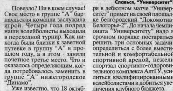
Славься, "Университет"! Свое место в группе "А" барнаульская команда заслужила игрой.