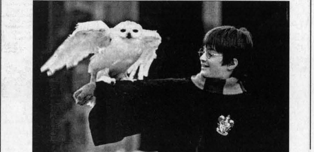
Гарри и его сова. "АП" продолжает пересказывать интернет-версию новой книги о Гарри Поттере.

НАШ КОНКУРС Мальчишки, девчонки, а также их родители - все, все, все, кто читает нашего Гарри Поттера! Мы обещали конкурсы - и вот они начинаются. В каждом выпуске мы будем задавать по три вопроса и раз в две недели будем проводить призы. Ваши ответы присылайте только письменно! Адрес: 656043, Барнаул, ул. Короленко, 105, "Алтайская правда", про Гарри Поттера. Имена победителей будут названы в "АП" за 25 июля.